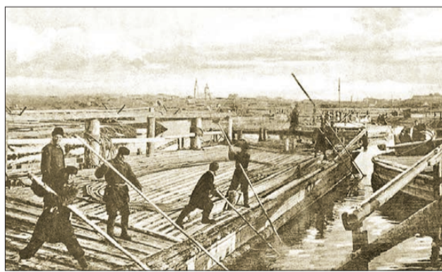
Железные караваны великой реки

Продолжаем изучать прессу двухвековой давности. Уже знакомую нам «Екатеринбургскую неделю», но годом позже. И на тему, актуальную сегодня — о пожарах. Публикация извещала «О мерах, принятых против лесных пожаров в Билимбаевской даче графа Строганова». Ее тоже можно найти в электронных недрах Белинки. Поводом написания статьи послужило то, что на общем фоне территорий, пострадавших от лесных пожаров «от