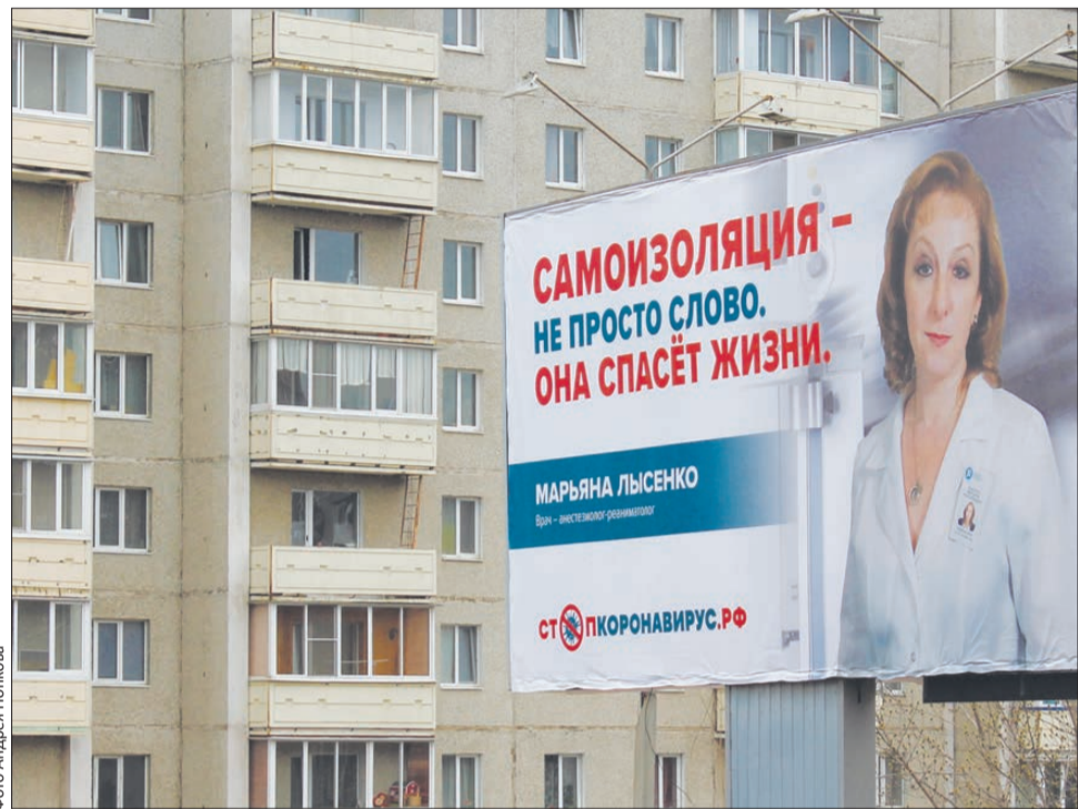
Наше здоровье – в наших руках! Оставайтесь дома!

К настоящему моменту выписаны двое заболевших, открывших список зараженных COVID-19 в Первоуральске. Всего же в городском округе, по состоянию на 7 мая, зарегистрировано 22 случая.