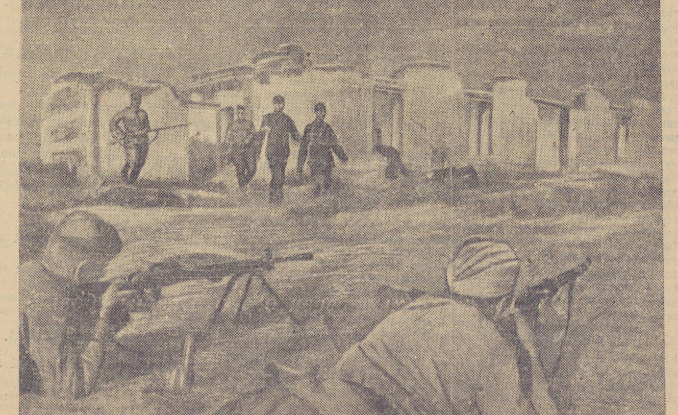
ДЕЙСТВУЮЩАЯ КРАСНАЯ АРМИЯ. В населенном пункте М. отбитом нашими войсками. На снимке: красноармейцы подразделения старшего сержанта ХУДОВЕРЛОВА выбивают засевших в домах гитлеровцев.

и мелкие разведывательные группы. Нашими разведчиками в течение ночи уничтожено 9 пулеметов, танк, орудие, 2 минометных батареи и истреблено 170 гитлеровцев.