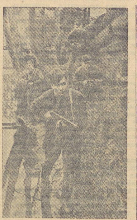
ДЕЙСТВУЮЩАЯ АРМИЯ (Ленинградский фронт)...