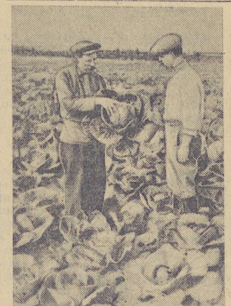
Обильный урожай овощей и картофеля зрел в предгорном колхозе им. Чапаева (г. Серов).