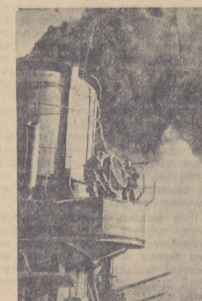
ДЕЙСТВУЮЩАЯ ЧЕРНОМОРСКАЯ ФЛОТ. На снимке: крейсер ставит дымовую завесу.