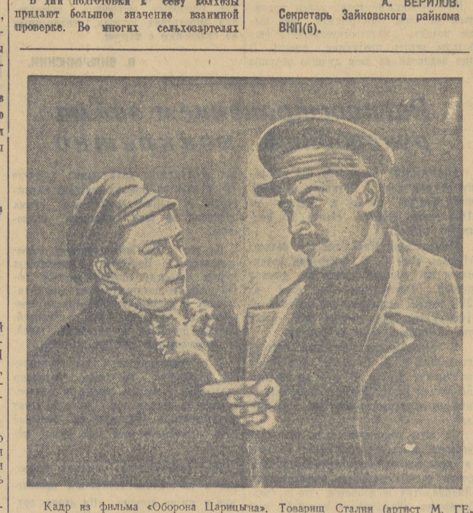
Кадр из фильма «Оборона Царицына». Товарищ Сталин (артист М. ГЕЛОВАН) беседует с молодой царькинской работницей Катей Давыдовой (артистка В. МЯСНИКОВА).

Колхозы Зайковского района, выполняя обязательства, выданные в новом году колхозами Уральского товариществу Сталину, по боевому готовности встретить весенний сев. В сельхозартелях «Красное знамя», «Путь к социализму», имени Сталина и других семеноводческие и полностью выведены до посевной кондиции. Сельхозинвентарь отремонтирован. Рабочие планы составлены. С нормами выработки ознакомлены все колхозники. Фронтальная полеводческая бригада, организованная в колхозе имени Сталина, поставила перед собой задачей — получить стоголовый урожай. Сейчас зябле, занятое вывозкой навоза, систематически выполняется задание по 150 прог. В дни подготовки к севу колхозники придают большое значение взаимной проверке. Во многих сельхозартелях Горкинской и Зайковской МТС организована. Пробные высева состоялись в колхозах «Возрождение», имени Кирова, «Ленинский путь», «Красный Урал», «Новая деревня» и других. Соревновались между собой члены артелей «Знамя Ленина» и «Возрождение» проверили друг у друга подготовку к севу, присутствовали на пробных высевах, составили, как успешнее подготовиться к севу. В колхозах имени 8 марта, имени Первого мая и других проводилась самопроверка по бригадам. Успех сельхозхозяйственного года будет зависеть от тщательной подготовки к севу. И колхозы стремятся встретить его во всеоружии. Секретарь Зайковского района ВВП(б). А. ВЕРИЛОВ.