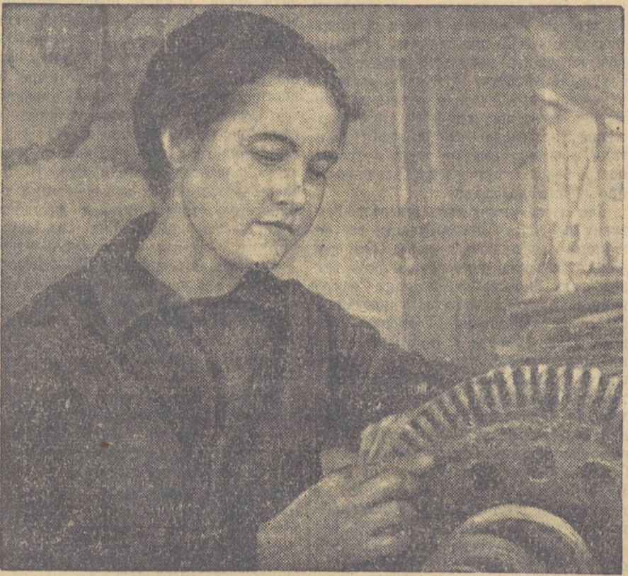
Соревнование за знамя 3-й гвардейской дивизии рождает на Кировградском металлургическом заводе новые сотни передовиков производства...