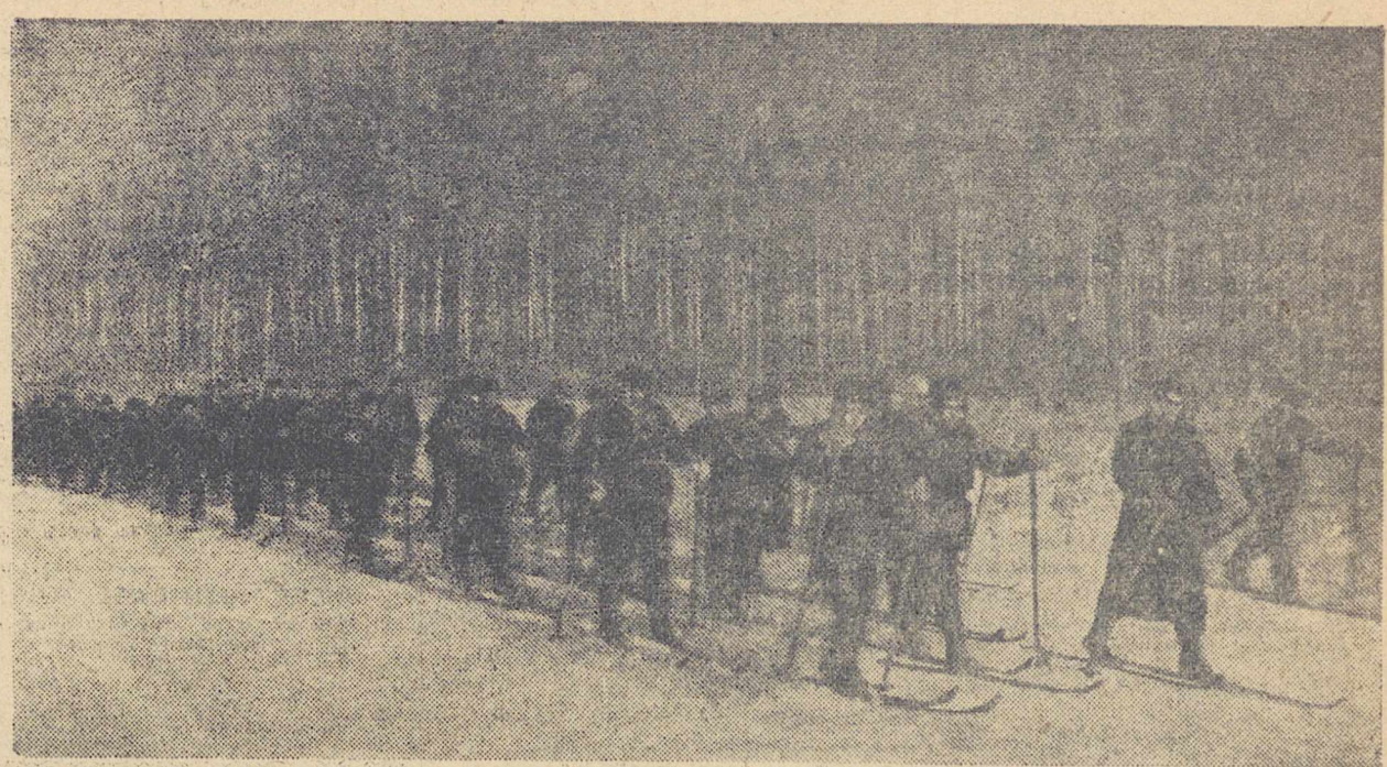
На снимке: бойцы всеобуча Сталинского района г. Свердловска на походе.