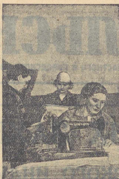
Работницы огневой нормы пеха Берх-Исетского завода организовали во внеурочное время пошив теплых вещей для бойцов Красной Армии.