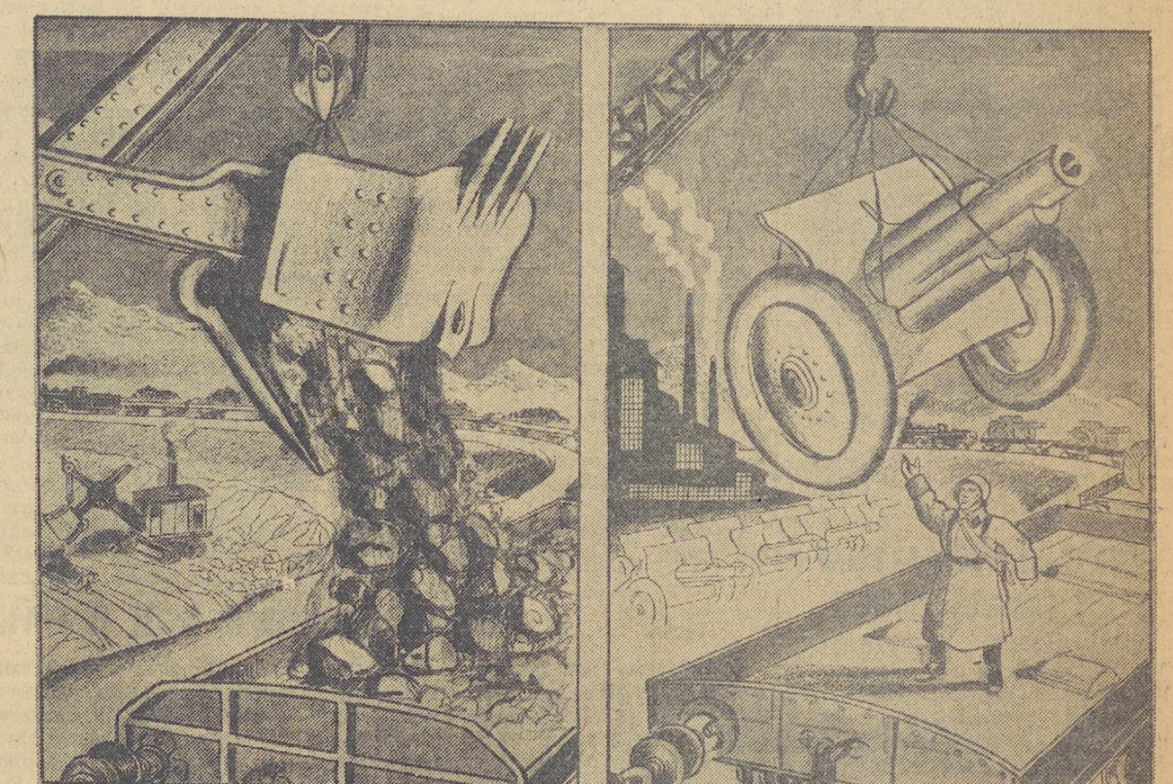
КАЖДАЯ ТОННА РУДЫ ДЛЯ ЗАВОДА — ПОМОЖЕТ РАЗГРОМУ ФАШИСТСКОГО СБРОДА!

Мерно и гудко звучит их шаг в притихших переулках Пресни, на ровном асфальте Ленинградского шоссе, на широкой площади заставы Ильича. Звук шагов и слова бойцов несут отзвуки эпохи истории. Здесь проходили бои декабрьских баррикад 1905 года, отряды, двинувшиеся с юнкерами в Ок-