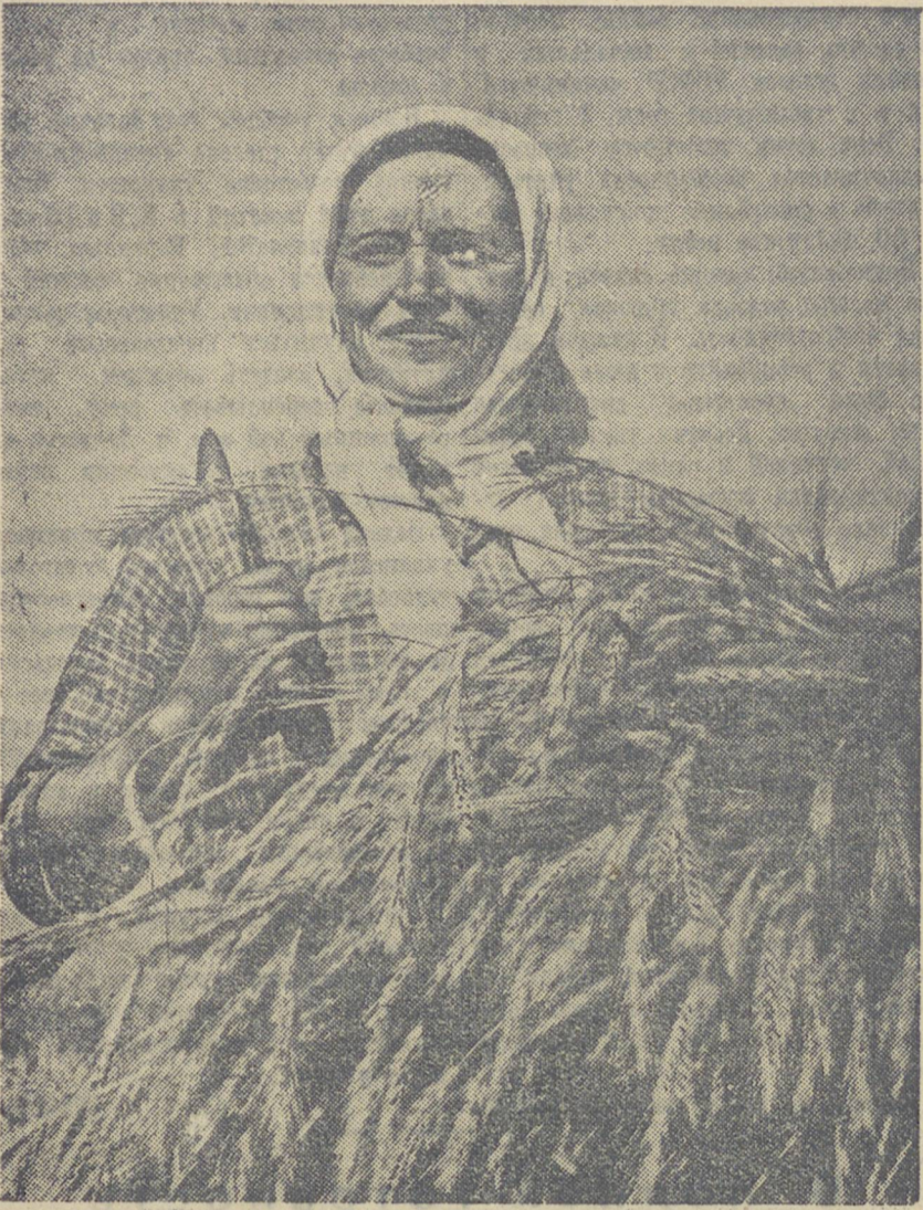
В ответ на обращение колхозников сельхозартеля «Вперед»...