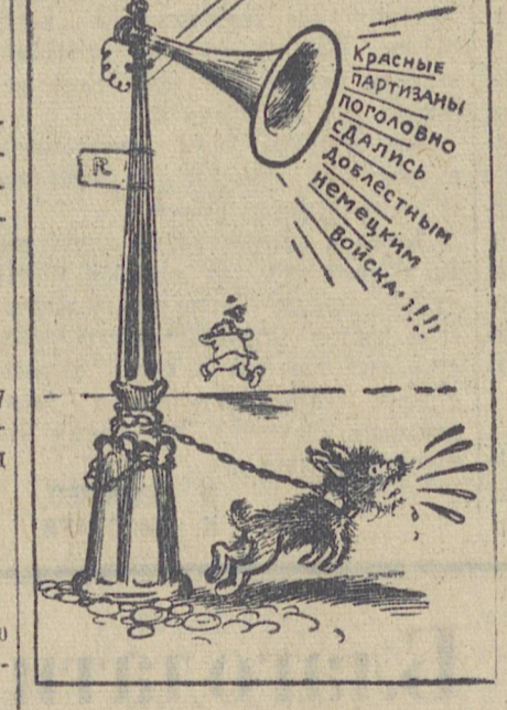
Рис. Г. Ляхина.

Берлинские издательские мало верят в успехам военным сводкам, составляемым Гельб-швац, и избегают слушать их по радио. (Из газет).