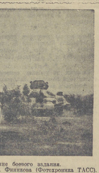
ДЕЙСТВУЮЩАЯ АРМИЯ. На снимке: танки выходят на выполнение боевого задания.