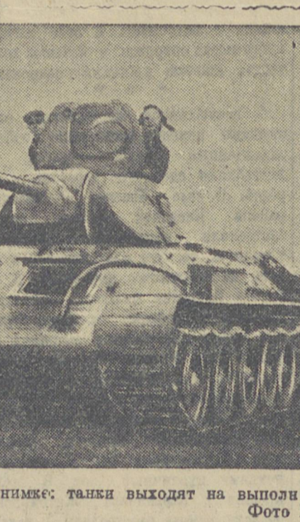
ДЕЙСТВУЮЩАЯ АРМИЯ. На снимке: танки выходят на выполнение боевого задания.