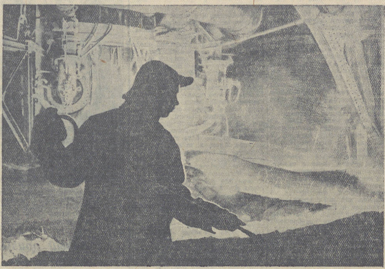
Выпуск чугуна в доменном цехе металлургического завода имени А. К. Серова.