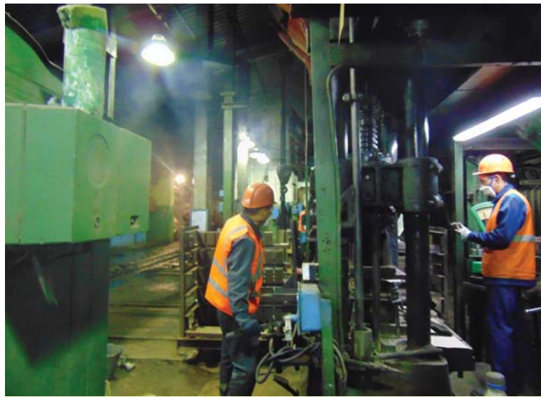
Все передельные второго цеха работают в полном режиме.

На выполнение планов текущего месяца работают строители, транспортники, служба технологического контроля и качества, все вспомогательные подразделения.