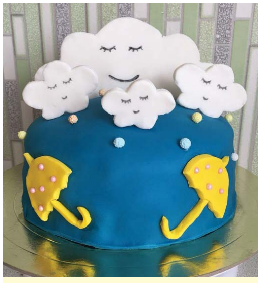
Торт от Анны Клементьевой.