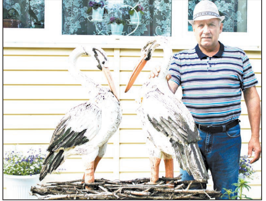
Аисты принесли счастье