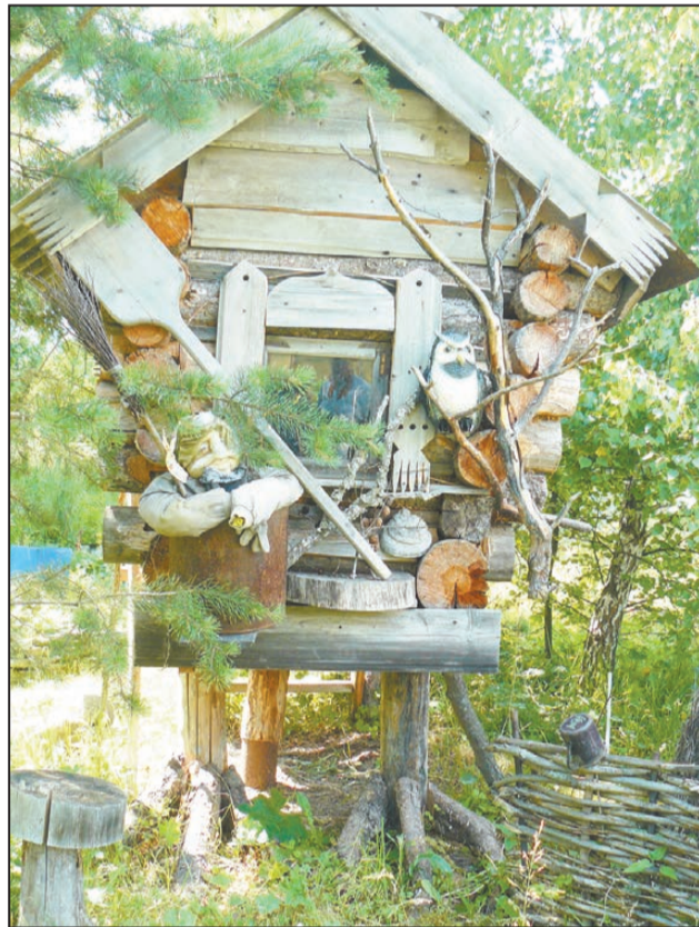
Повернись, избушка, ко мне передом...

«Здесь все пропитано историей, я горжусь этим...»