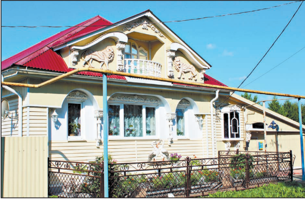
Многие считают этот дом лучшим на Урале