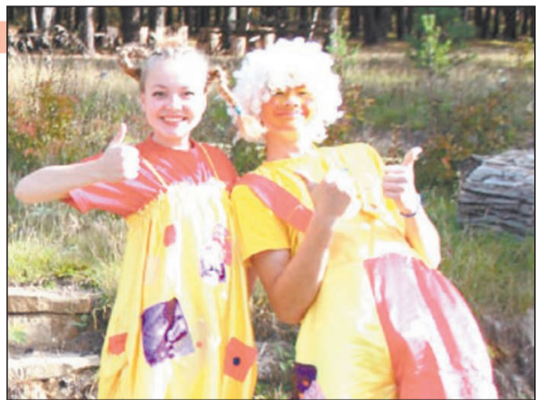
Волонтерство - это еще и весело!

- Медиаволонтер - это одно из направлений добровольческого движения, в котором можно помогать своим умениями фотографировать, писать, снимать на видео. Наш ежегодный фестиваль «Круг друзей» как раз наглядный пример. Ребята приходили со своими фотоаппаратами, видеокамерами, делали любительские снимки, устанавливали музыкальную аппаратуру и так далее. Они получали навыки, а все зрители, пришедшие на мероприятие, - замечательный праздник и хорошее настроение. Приобретенные навыки они уже претворяют в жизнь. Как видите, волонтерство не сводится только к озеленению и облагораживанию терри-