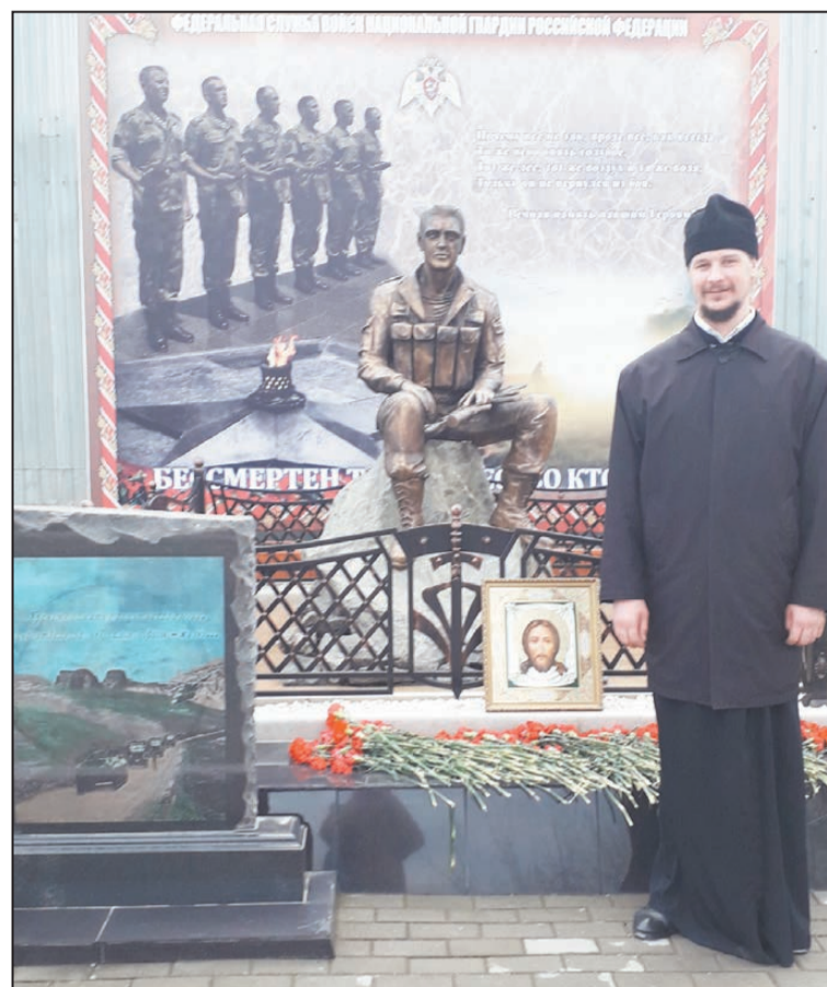
У памятника «Защитникам России» в г. Ханкале (ОГВс)

Есть среди бойцов и мусульмане, и буддисты. И мы устраиваем занятия, чтобы мы друг о друге побольше узнали. Например, в прошлой командировке устроили в храме библиотеку, и в ней выдавали не только книги, но и взятые с собой компакт-диски. А в той части храма, которую принято называть притвором, устраива-