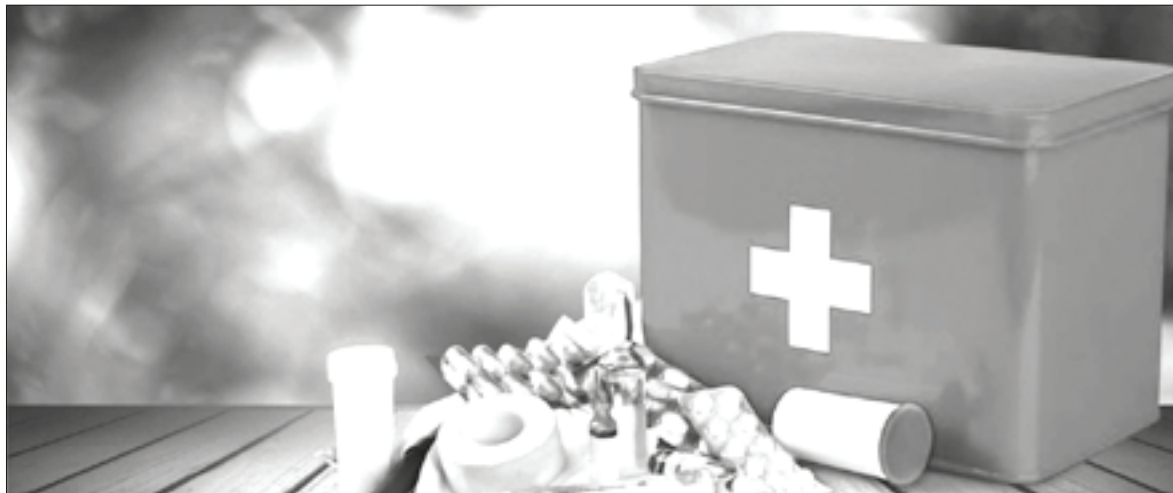
☞ Не забывайте иногда заглядывать в аптечку и проверять, не вышел ли срок годности у препаратов: возможно, что-то уже пора выбрасывать и купить на замену то же самое, но новое

– В США метамизол (международное название анальгина. – Прим. ред.) запрещен с 1977 года. Он может вызывать агранулоцитоз (снижение количества гранулоцитов в крови. – Прим. ред.), – говорит заведующая кафедрой фармако-