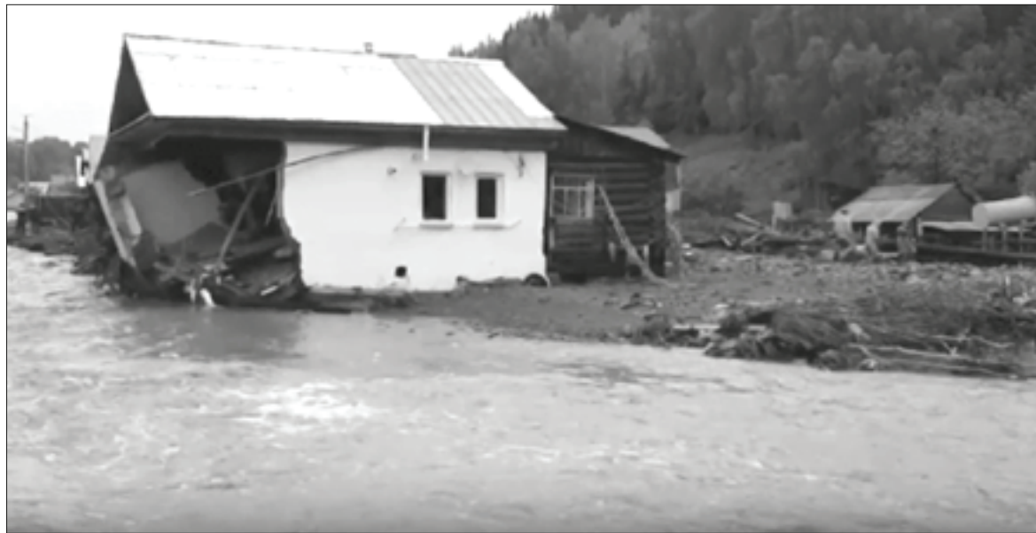
20 июля в Нижних Сергах за несколько часов выпало 120% месячной нормы осадков. В результате паводка около двухсот домов оказались подтоплены, пять – разрушены