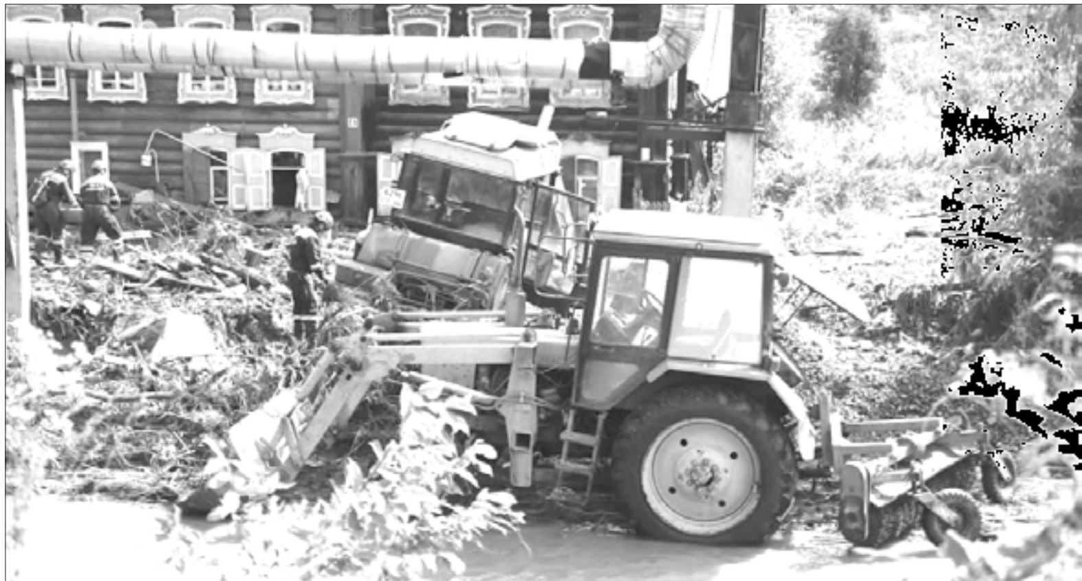
☞ Стихия беспощадна, и нужно всегда быть готовыми к ее ударам

Превышение установленной законодательством продолжительности рабочего времени, а также привлечение работников, не достигших возраста 18 лет, к сверхурочной работе не допускается. Несоблюдение требований об установлении сокращенного рабочего времени, в том числе, включение условий об этом в трудовой договор, заключаемый с несовершеннолетним работником, влечет привлечение работодателя к ответственности, установленной ст. 5.27 КоАП РФ.