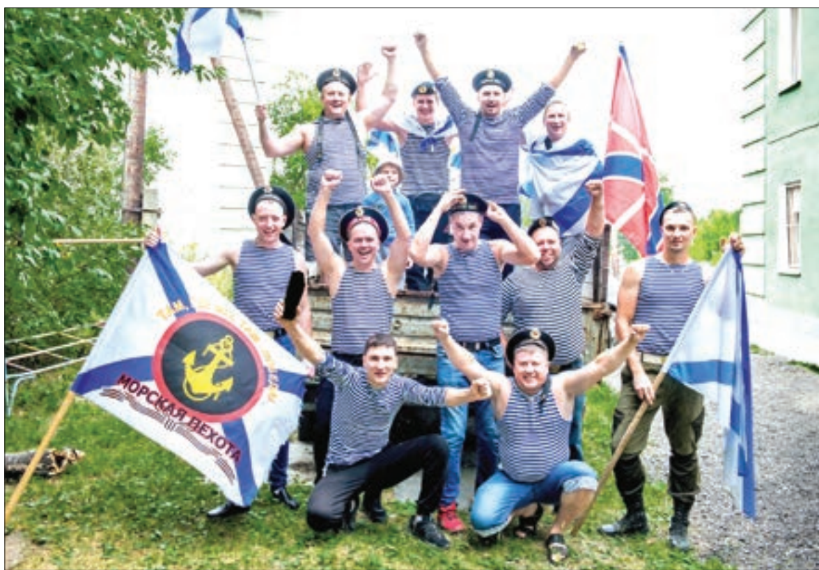
Морские традиции соблюдаются и в мирной жизни. Морское братство – это навсегда

Вот и нынче, 26 июля, в День ВМФ, они не упустили возможности встретиться, чтобы опять обняться, спросить друг друга про семью, планы, про жизнь, рассказать о себе. И вот так вот сфотографироваться на память.