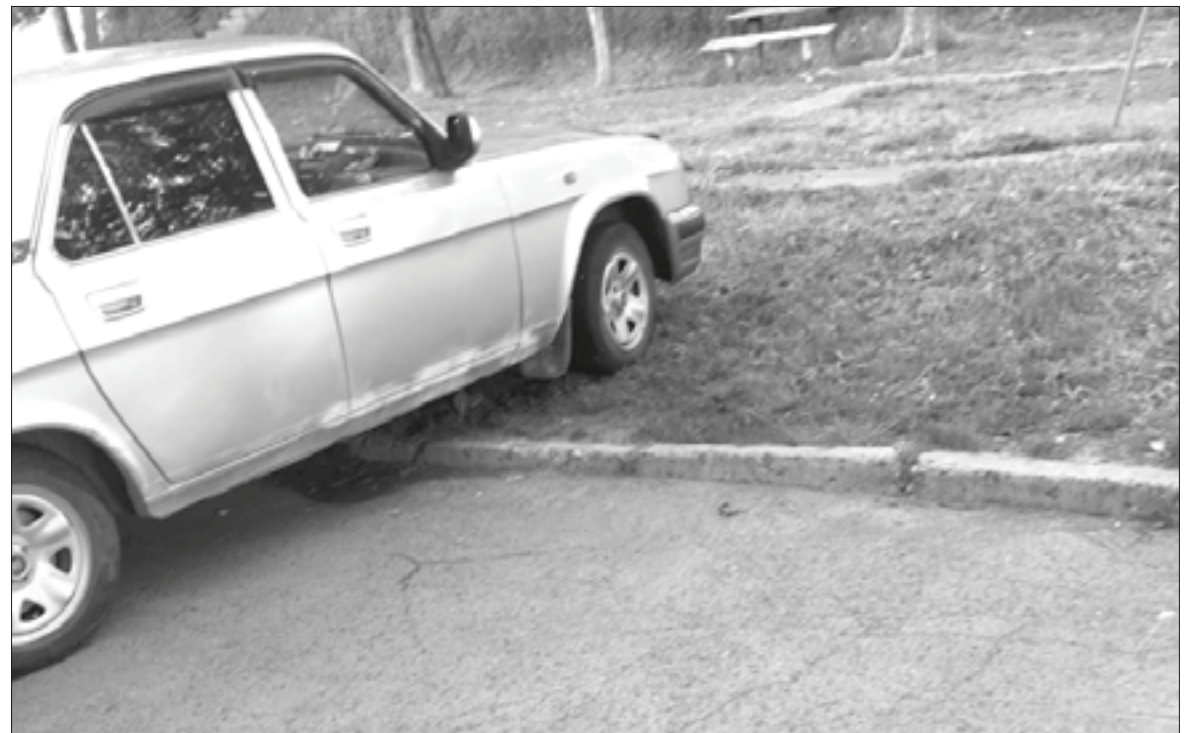
☑ За самовольную установку ограждений и иных конструкций на дворовых территориях для обозначения мест размещения транспортных средств на граждан налагается штраф в размере от 3 до 5 тысяч рублей

Необходимо помнить, что не для всех участков, занятых многоквартирными домами в НТГО, установлены границы. До 31 декабря 2020 года планируется завершение работ по их уточнению, после чего у собственников и появится возможность организации парковки на общедомовом участке.