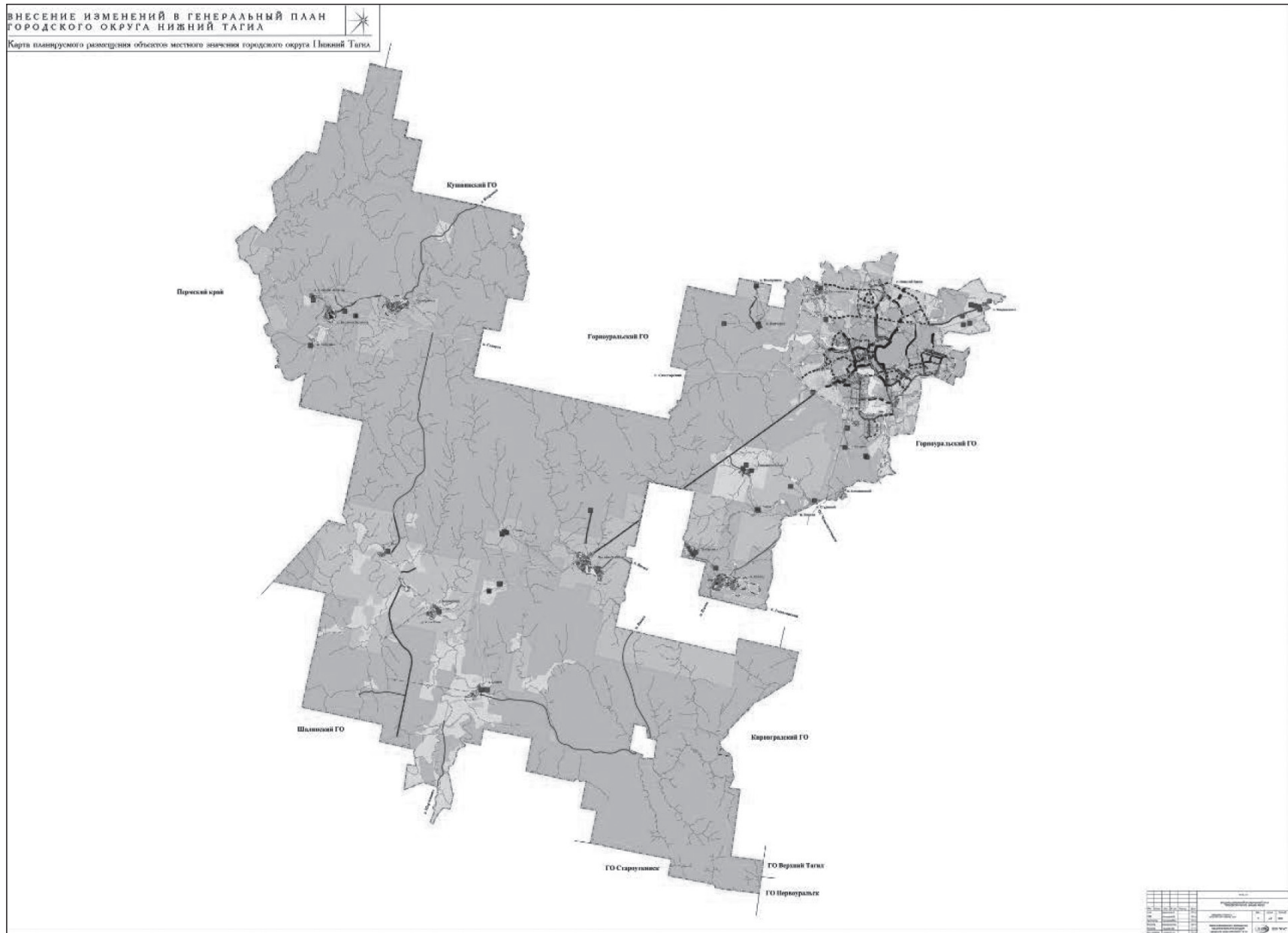
Карта планируемого размещения объектов местного значения городского округа Нижний Тагил

к Решению Нижнетагильской городской Думы от 23.07.2020 № 27