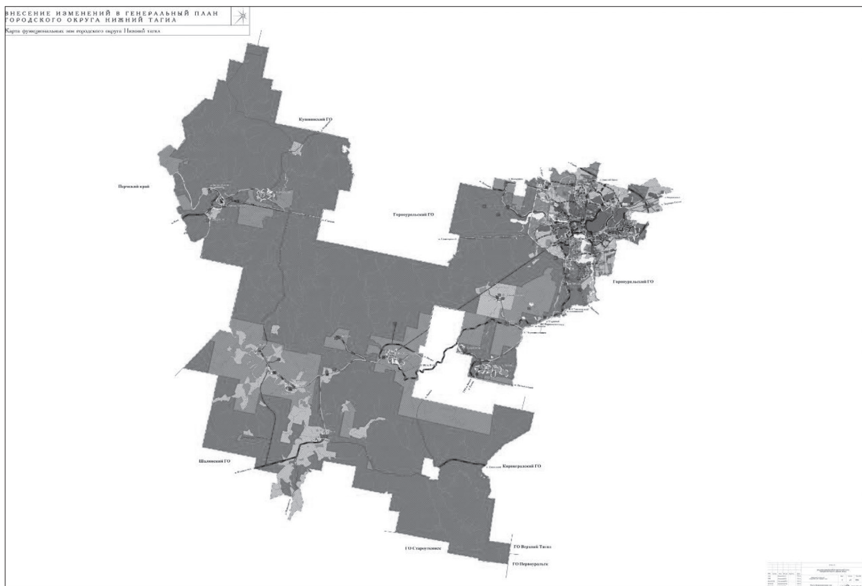
Карта функциональных зон городского округа Нижний Тагил

(В цветном варианте карты смотрите на официальном сайте города ntagil.org)