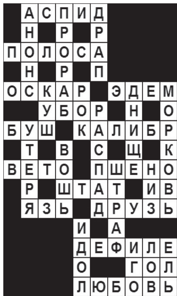
Ответы на сканворды из выпуска № 31 (1296)