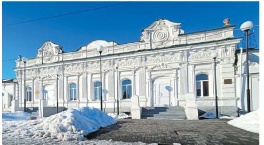
Здание типографии - одно из самых красивых