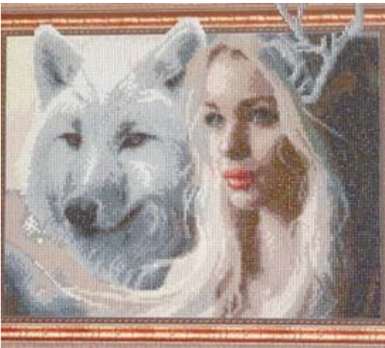
■ В каждой работе - частичка души мастера