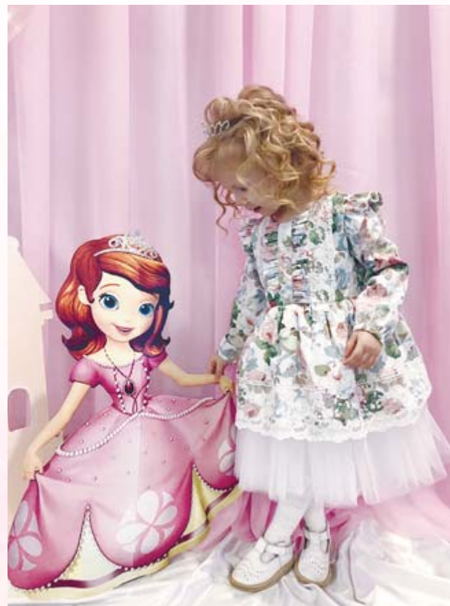
■ Главная модель Веры - дочка Виолетта