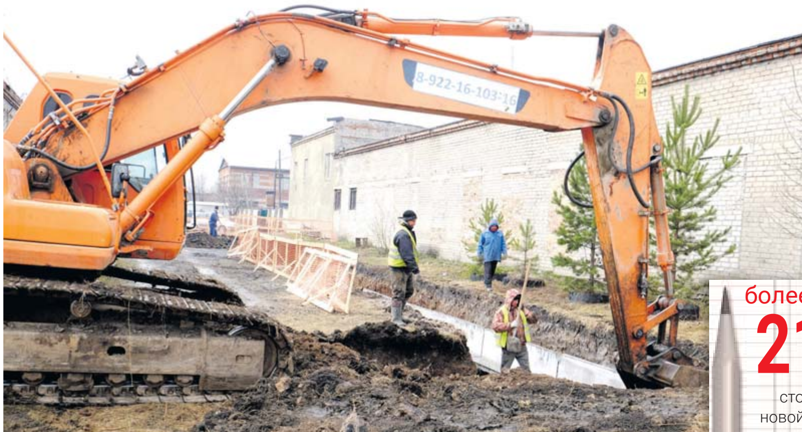
Во дворе дома 113 по улице Колногорова идёт укладка лотков для трубопровода

Анастасия ФИРЦОВА