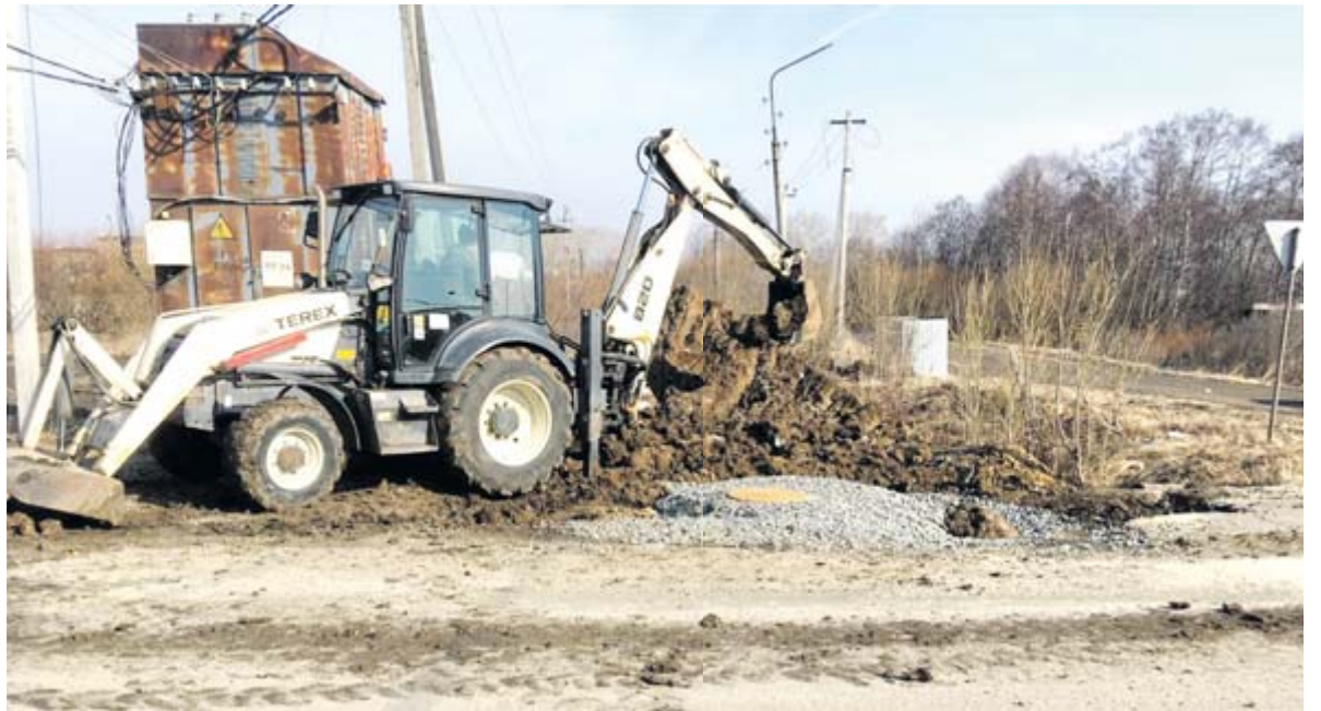
Благоустройство территории после строительства водопроводной трассы на углу улиц Радищева-Лермонтова

Следующим масштабным проектом в сфере городского водоснабжения должно стать строительство сетей в посёлке Нейво-Шайтанском. В данный момент продолжается работа