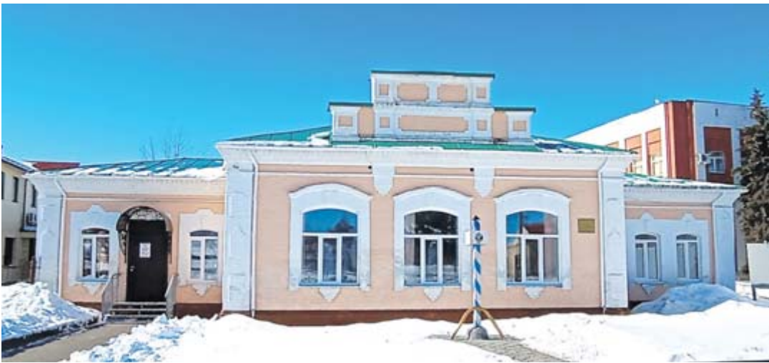
Купеческий дом - памятник архитектуры