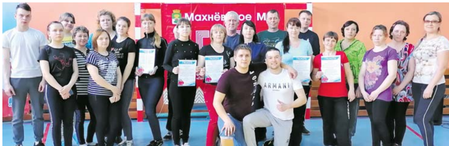
Сдали нормативы ГТО и укрепили здоровье