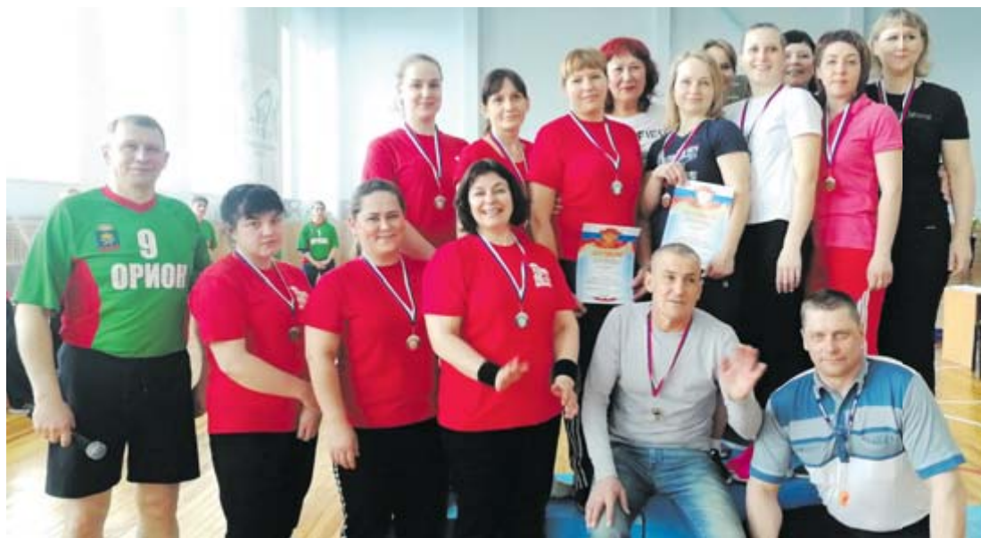
Команды АУЖД и «Взлёт»