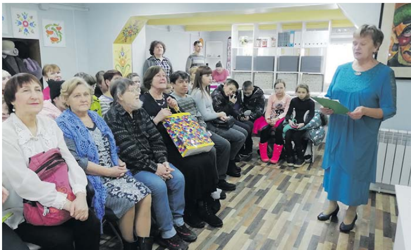
■ На открытие выставки пришли друзья и единомышленники

В. МАХНЁВА, экскурсовод Нижнесинячихинского музея