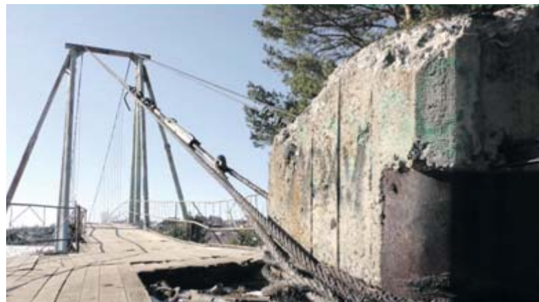
Рабочие «Алапаевской автоколонны» за четыре дня выровняли мост и заменили тросы

Анастасия ФИРСОВА