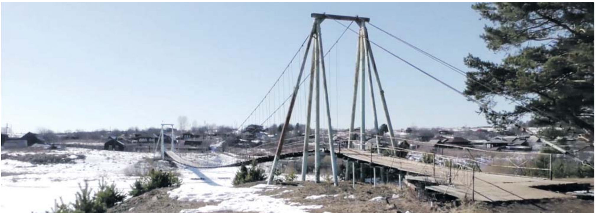
Общая протяжённость моста 157 метров