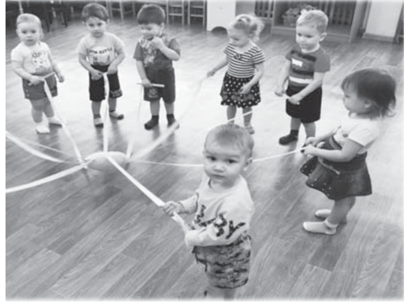
«Малышарики». Нестандартное оборудование