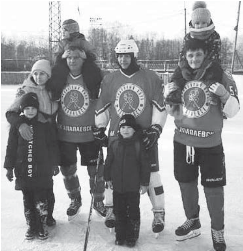
Группа «Звёздочки». Открытие хоккейного сезона

С ноября 2019 года по март 2020 года детский сад № 41 принимал участие в муниципальном конкурсе «Мы за здоровый образ жизни», реализовывая проект в номинации «Лучший опыт работы с родителями по формированию культуры здоровья и здорового образа жизни детей».