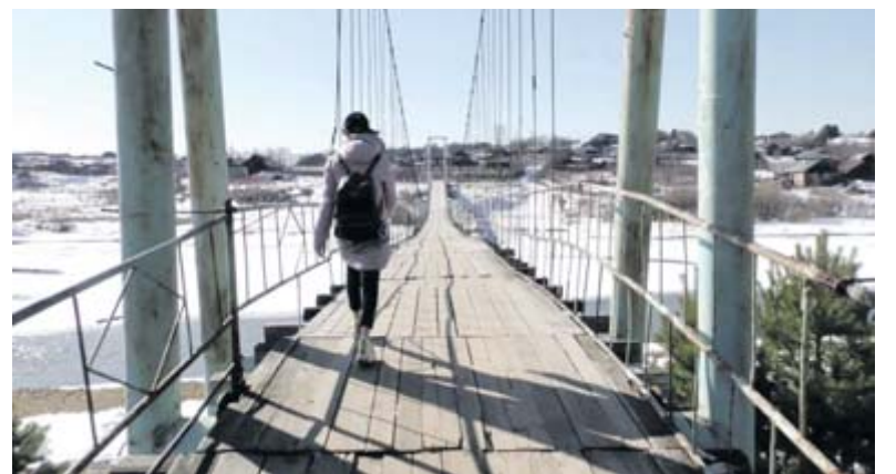
Теперь по мосту можно безопасно передвигаться

в соответствии с постановлением администрации средства из резервного фонда могут быть выделены на проведение неотложных аварийно-спасательных и аварийно-восстановительных работ, в том числе капитального характера, на объектах жилищно-коммунального хозяйства, социальной сферы, промышленности, транспортной инфраструктуры и сельского хозяйства. Если они способствуют предотвращению возникновения чрезвычайной ситуации муниципального и локального уровня.