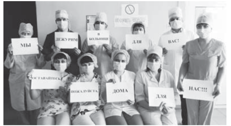
Оставайтесь, пожалуйста, дома!

Департамент информационной политики Свердловской области