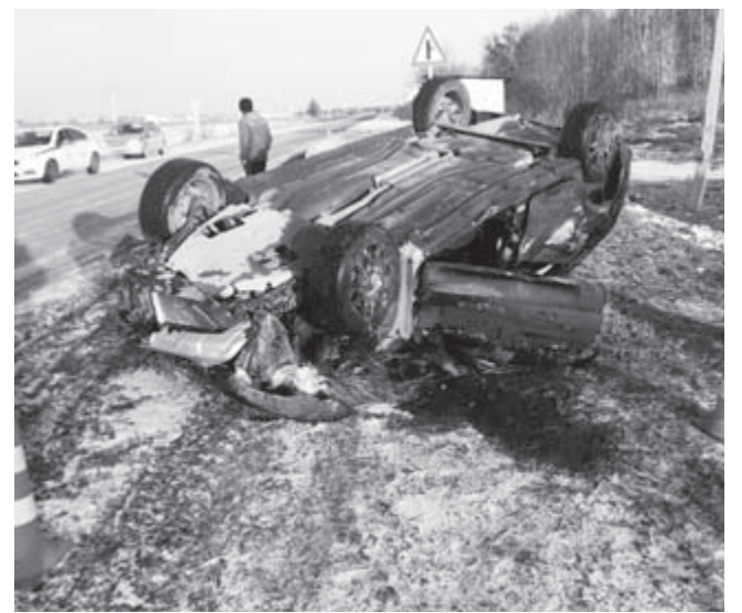
Всё, что осталось от авто