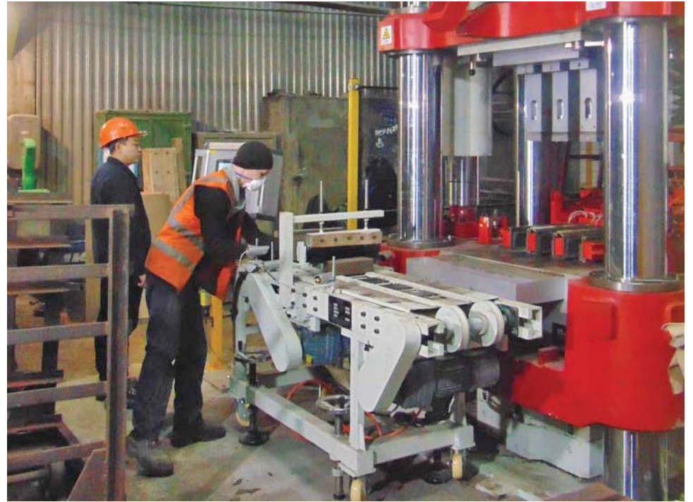
11 октября 2019 года новый гидравлический пресс начал выдавать продукцию.

Первый большой объект 2020-го – отремонтированная печь РКЗ-4 №2. Заменены ванна и свод. Заводские строители впервые заранее смонтировали и установили корпус печи целиком. Эта рационализаторская идея помогла значительно со-