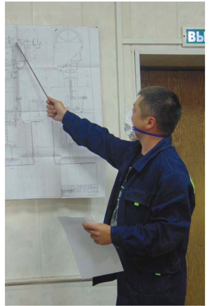
В конкурсе было два этапа - практический и теоретический.

деталей, периодичность смазки, допустимые отклонения сырца по размеру, кривизне, объёмному весу, нормативы на сырец, какие компоненты входят в состав диначесовых масс и многое другое.