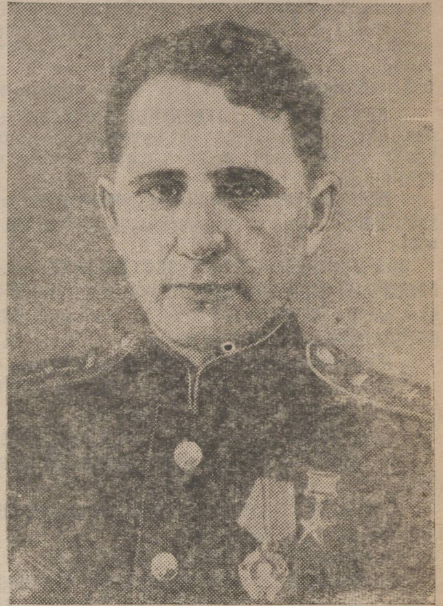
Герой Социалистического Труда Авадей Каллистратович ЧЕРЕПАНОВ, награжденный орденом «Знак Почета».