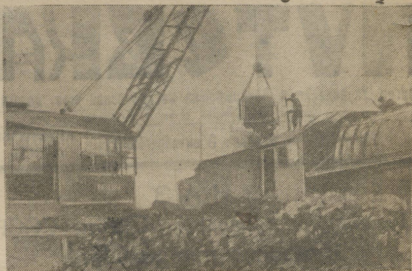
Подача угля на паровоз на Камышловском складе топлива.