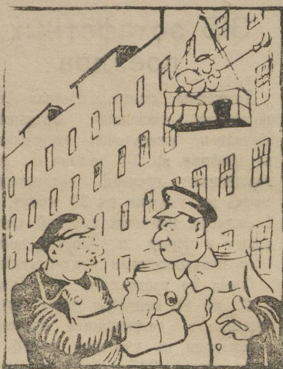
Рисунок А. КУПРИНА.

Пришел, увидел, побелил, У двери ручку прикрутил. Ремонт закончен