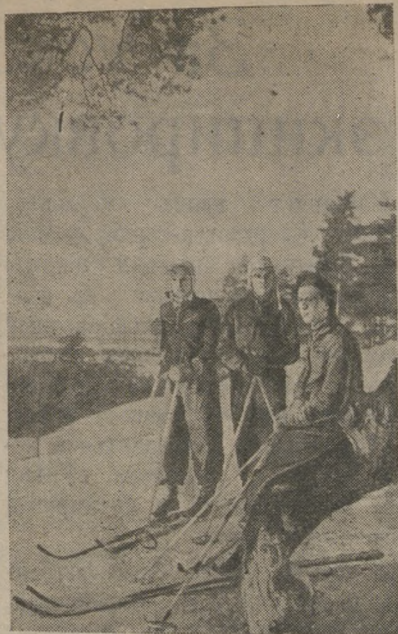
Пригород Таллина — Немме — излюбленное место зимнего отдыха трудящихся Таллина. На снимке: группа молодежи на лыжной прогулке на Немме.