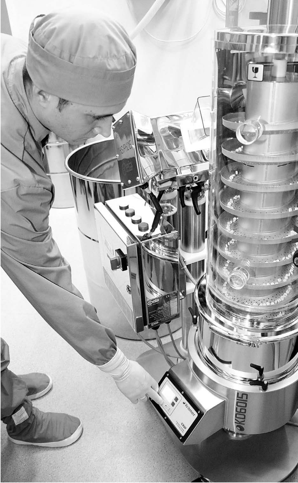
Фармпредприятия России сегодня оснащены современным оборудованием, вот только пилили производят в основном из импортного сырья.

Но, как показала жизнь, из-за возросшего спроса весь объем