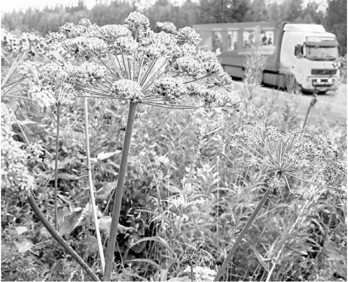
Борщевик захватил десятки гектаров земли вдоль автодорог.

Досталась нам эта проблема в наследство от СССР: борщевик культивировали как неприхотливое растение на силос, но после того как выяснили, что оно отрицательно влияет на приплод скота, от централизованного выращивания отказались. Сегодня борщевик распространяется стихийно, поданным Россельхозцентра, его общая площадь в России ежегодно увеличивается на десять процентов. Только на территории Свердловской области в прошлом году было выявлено 167 гектаров. Из них 105 — населенных пунктах, 31,8 — на заброшенных угодьях, остальное вдоль дорог.