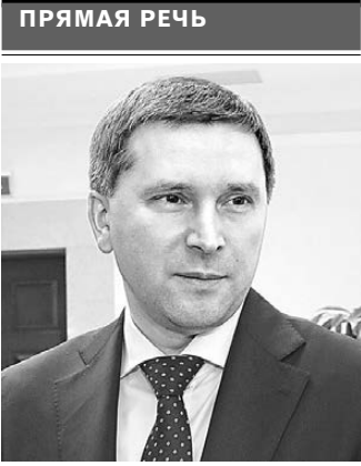
Дмитрий Кобылкин, министр природных ресурсов и экологии РФ:

Что касается переработки, то в минэнерго рассчитывают на активное участие бизнеса. Через четыре года на вторичную переработку планируется отправлять не менее 36 процентов бытового мусора. Чиновники надеются: пилотный проект привлечет интерес бизнесменов и поможет выяснить потенциальный объем вторсырья. ●