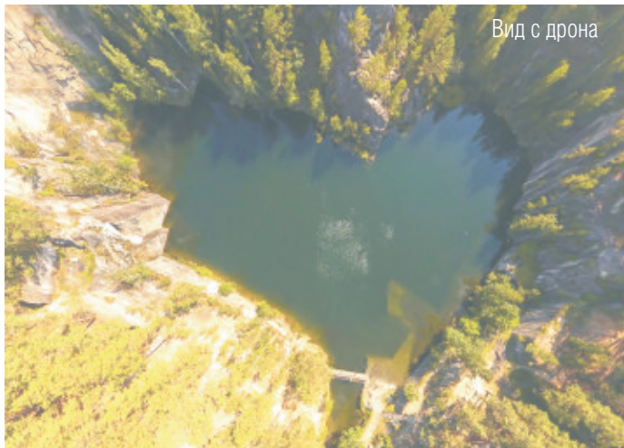
Вид с дрона