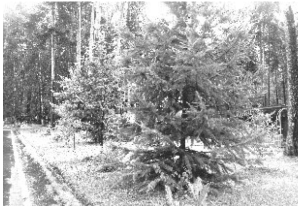
Эта лиственница - ровесница нового здания «Светлячка»