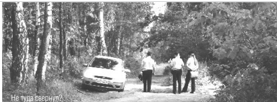
Не туда свернул?