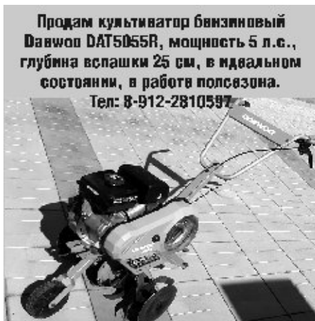
Продам культиватор бензиновый Dayan DAT5055R, мощность 5 л.с., глубина вспашки 25 см, в идеальном состоянии, в работе полсезона. Тел: 8-912-2810597