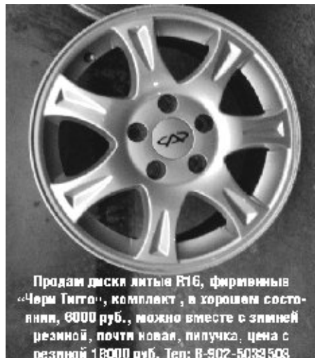
Продам диски литые R16, фирменные «Чери Тигго», комплект, в хорошем состоянии, 6000 руб., можно вместе с шиной резинной, почти новая, пилучка, цена с резинной 18000 руб. Тел: 8-902-5033503