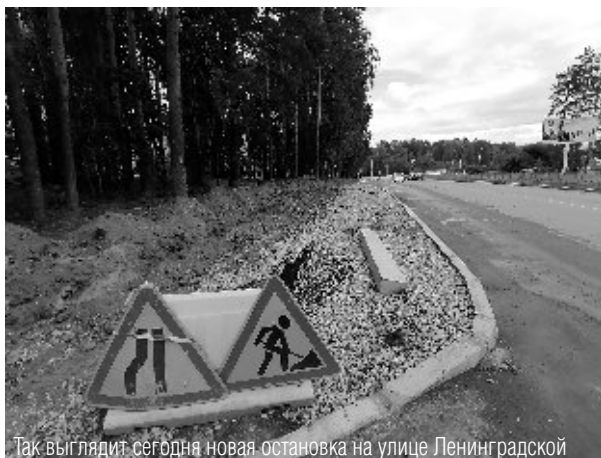
Так выглядит сегодня новая остановка на улице Ленинградской

Об этом стало известно на заседании городской думы 25 июня. Таким образом, муниципальные власти, наконец, согласились с мнением жителей.