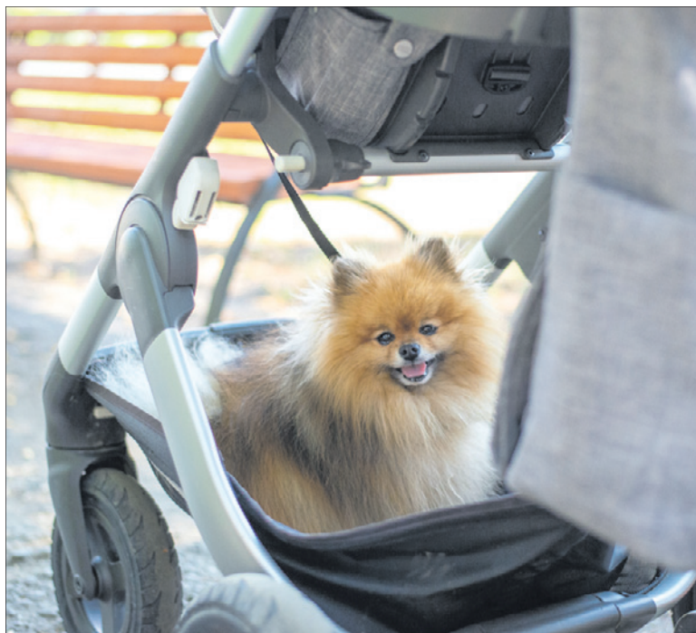
На прогулку первоуральцы часто берут маленьких собак. Кажется, этот щипц счастлив.