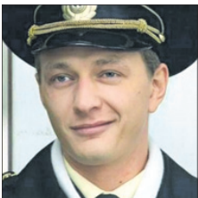
Первый • 21.30 «72 метра» (12+)

ПЕРВЫЙ 05.10 X/ф «Командир счастливой «Шуки» (12+) 06.00 Новости 06.10 X/ф «Командир счастливой «Шуки» (12+) 07.00 Цари океанов (12+) 08.00 Цари океанов. Фрегаты (12+) 09.00 День Военно-морского флота РФ (16+) 12.00 Новости 12.10 День Военно-морского флота РФ (16+) 13.00 Торжественный парад ко Дню Военно-морского флота РФ (16+) 14.15 Новости 14.30 X/ф «Черные бушлаты» (16+) 17.50 Концерт «Офицеры» 19.10 X/ф «Офицеры» (0+) 21.00 «Время» 21.30 X/ф «72 метра» (12+)