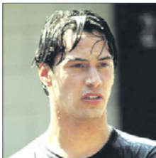
СТС • 00.25 «На гребне волны» (16+)