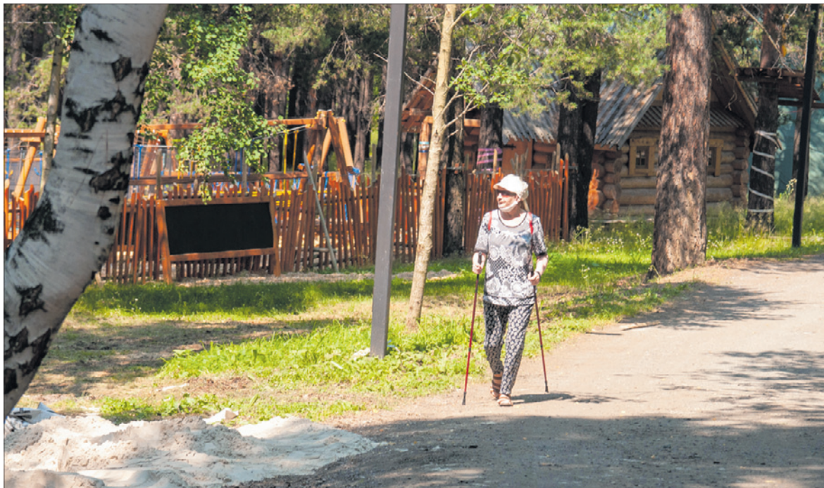
Бодро пройти по тенистым аллеям — отдельное удовольствие.

Атракционы по-прежнему не работают (и улей-парк тоже). Всех посетителей просят соблюдать социальную дистанцию и носить маски (голос диктора периодически напоминает о действующих правилах). Закрыт и зоопарк. Поэтому из обитателей парка вы встретите только воронов, белок, дятлов (им сейчас, кстати, тоже жарко).