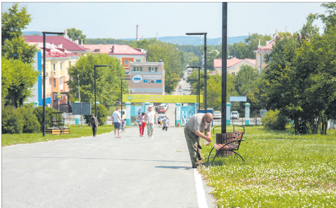
Работает парк с 7.00 до 19.00.