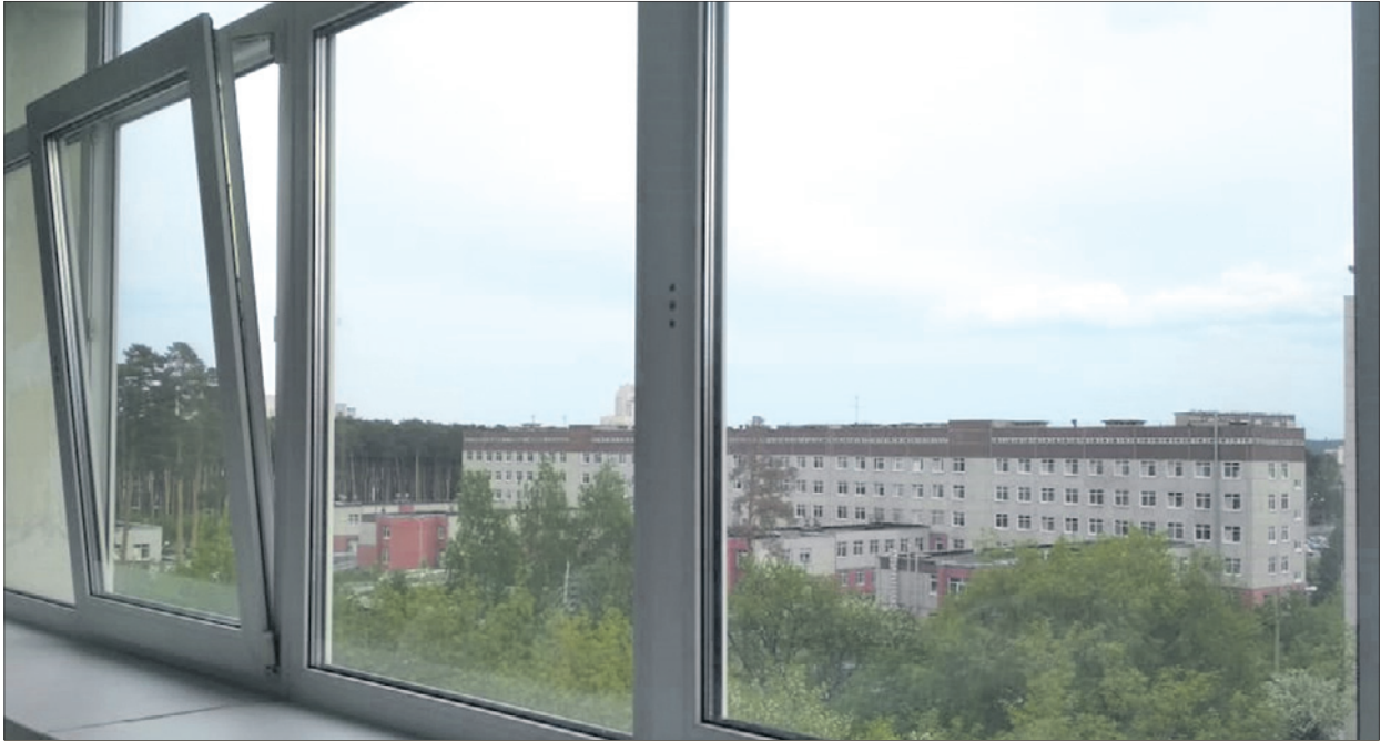
Вид из окна палаты в 40-й больнице.