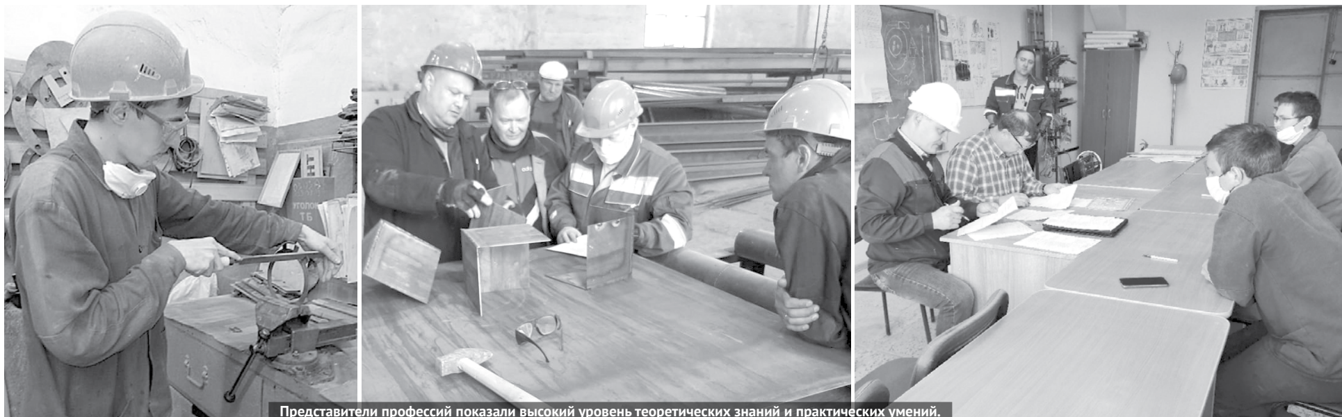
Представители профессий показали высокий уровень теоретических знаний и практических умений.

практической части. Обычно после цеховых конкурсов победители выходят на соревнования заводского уровня, но в сложившихся условиях с коронавирусом этот этап пока остаётся под вопросом. Конкурсы профмастерства входят в социальную программу предприятия. Борясь за звание лучшего по профессии, молодежь стремится показать свою квалификацию, заинтересованность в работе и получает заслуженное внимание и почёт.