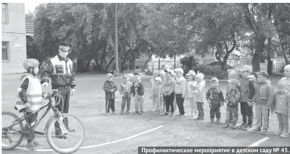
Профилактическое мероприятие в детском саду № 45.

«Бахус», «Стоп-контроль», «Внимание, каникулы», «Пешеход, пешеходный переход». Например, недавно сотрудники Госавтоинспекции совместно с коллегами из подразделения по делам несовершеннолетних