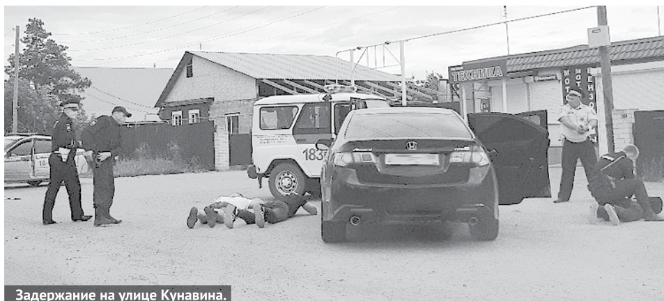
Задержание на улице Кунавина.

и центром молодежной политики и информации провели акцию «ПДД на асфальте». Инспекторы ГИБДД регулярно посещают образовательные учреждения нашего городского округа, где проводят профилактические беседы с детьми. О своей работе рассказывают в группе «Богданович 96» в социальной сети «ВКонтакте», где публикуют информацию о произошедших дорожно-транспортных происшествиях на территории городского округа, статистику аварийности, памятки по безопасности дорожного движения и другую полезную и актуальную для водителей и пешеходов информацию.