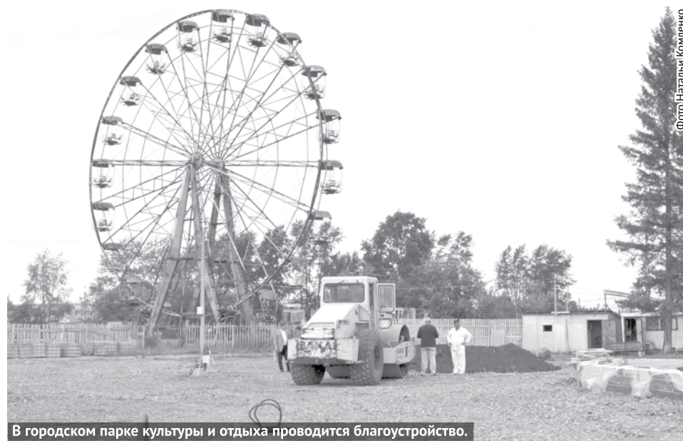
В городском парке культуры и отдыха проводится благоустройство.

Работа была проведена не только к открытию летнего сезона, но и ко дню рождения парка, отмечаемому в последние выходные июня. Мы ежегодно проводим большой праздник, но в этом году ограничительные меры внесли коррективы. Празднование прошло 28 июня, с 18 часов, в онлайн-режиме. Посмотреть онлайн-трансляцию можно было в группе парка в социальных сетях и в «Ютуб». Транслировались видеоролики с поздравлениями партнеров и друзей парка, концертные номера артистов не только нашего городского округа, но и ближайших городов. Двухчасовая программа была интересной и насыщенной. Можно было не только посмотреть концерт, но и поучаствовать в разных мастер-классах, играх и танцах с котом Богдашей. Завершилась трансляция брендовым роликом, посвященным благоустройству и развитию парка.