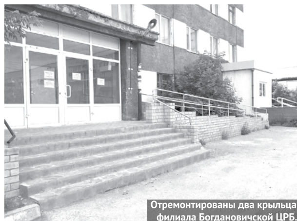
Отремонтированы два крыльца филиала Богдановичской ЦРБ.

анестезиологическое отделение, приёмный покой хирургического отделения, ряд иных помещений.