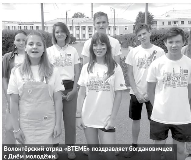
Волонтерский отряд «ВТЕМЕ» поздравляет богдановичцев с Днём молодёжи.

День молодёжи России ежегодно отмечается 27 июня. Праздник был учрежден распоряжением президента РФ от 24 июня 1993 года. В тренде новой реальности мероприятия в нашем городском округе в этот раз прошли в режиме онлайн