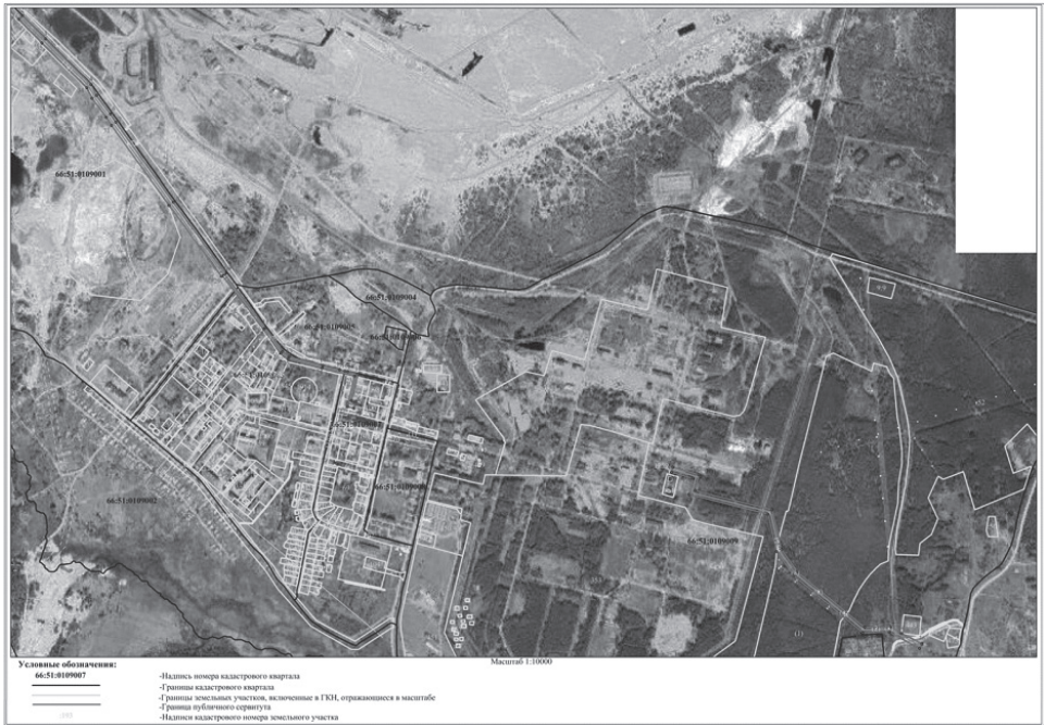
Приложение 2 к постановлению администрации городского округа Красноуральск от 15.06.2020 № 743

Расчет платы за публичный сервитут выполнен на основании ст. 39.46 Земельного кодекса Российской Федерации, Приказа Министерства по управлению государственным имуществом Свердловской области от 14.01.2014 № 39 «Об утверждении результатов определения кадастровой стоимости земельных участков в составе земель населенных пунктов, расположенных на территориях муниципальных образований Свердловской области: Камышловского городского округа, городского округа Карпинск, городского округа Красноуральск, Североуральского городского округа».