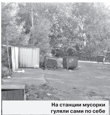
На станции мусорки гуляли сами по себе

Ураганный ветер вырвал деревья с корнями, дорожные знаки, срывал баннеры и вывески. С крыш домов сдувало не только шифер,