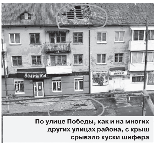
По улице Победы, как и на многих других улицах района, с крыш срывало куски шифера

но иногда и кирпичи. Шквалистый ветер во многих районах города оборвал провода электроэнергии, многие жители остались без света. От разгулявшейся стихии хорошо было мусорным контейнерам на станции, которые, так