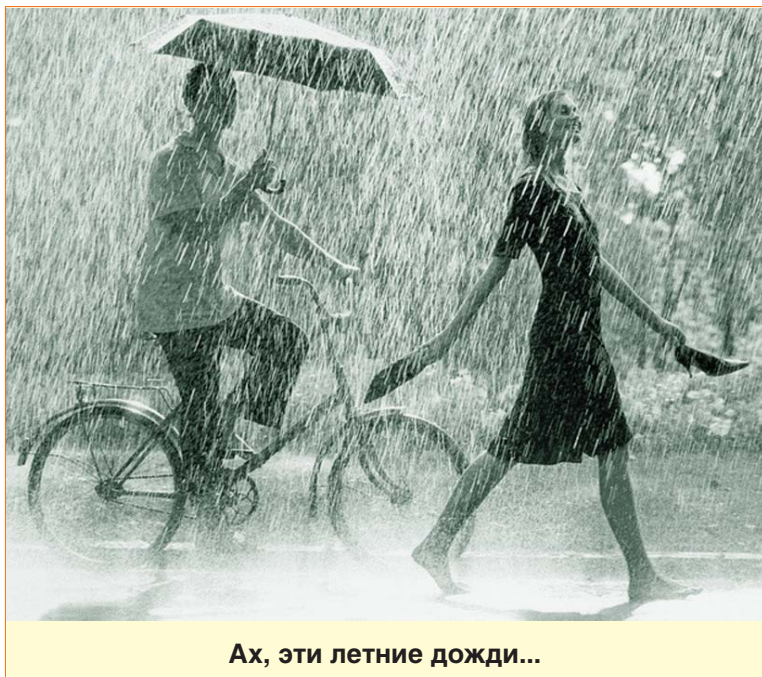
Ах, эти летние дожди...