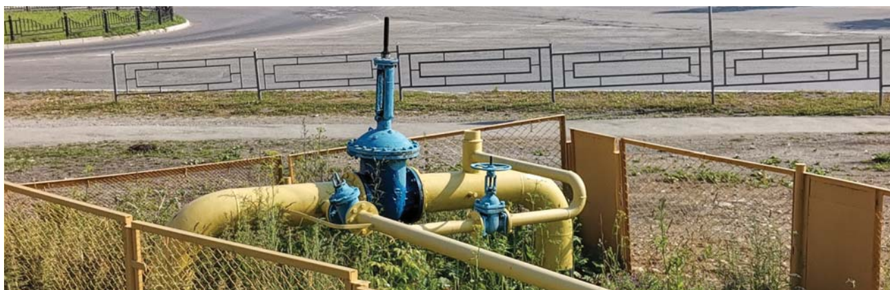
После проведения работ этот газовый узел будет скрыт под землёй.

- Есть вероятность, что после ремонта жильцы почувствуют запах газа в доме, в квартире? Возможны утечки?