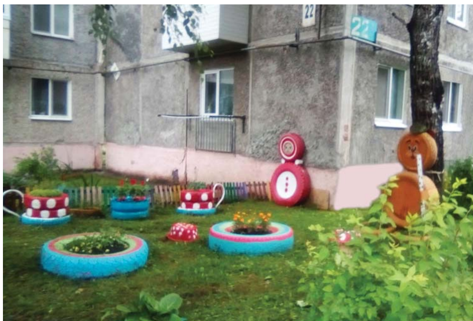
Своими руками и фантазией.