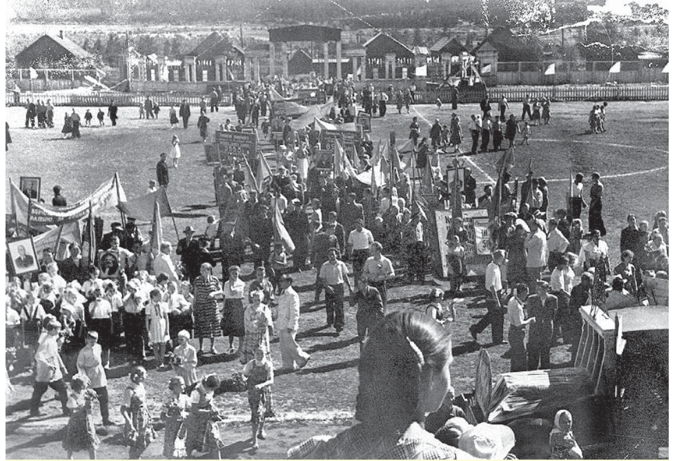
Главный праздник огнеупорщиков много лет проходит на заводском стадионе.

По поручению президента России губернатор вручил медали ордена «За заслуги перед Отечеством» II степени прессовщикам цеха №2