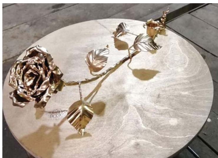
Эта роза никогда не увянет.