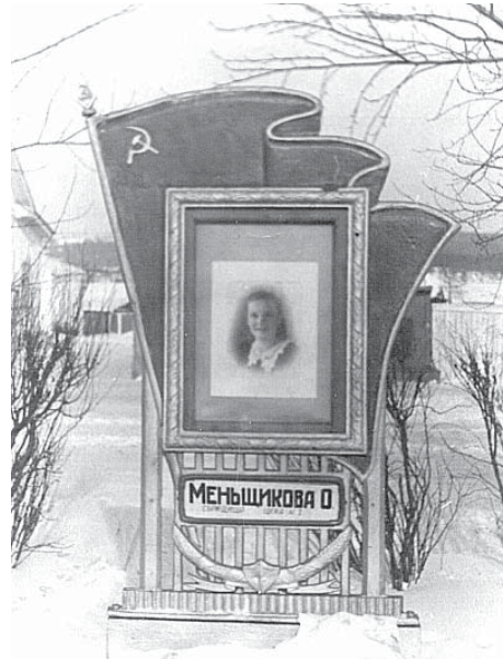
Фото из Галереи Почёта советских времён.

Часто собеседники вспоминают, как в детстве бегали рассматривать лица родителей, бабушек или дедушек на тех чёрно-белых фотоснимках.