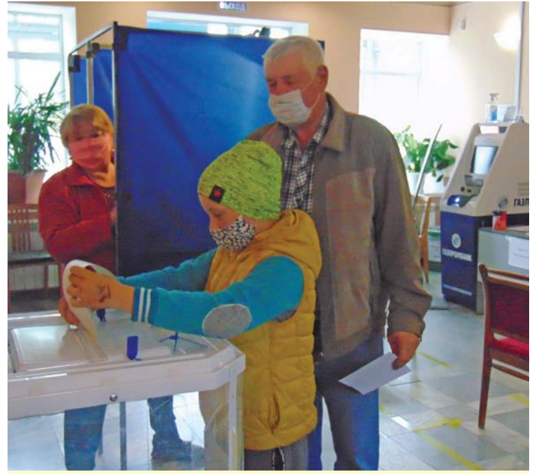
И я тоже голосую.

Впервые провели голосование на придомовой территории. 30 июня выезжали в район улиц Тракторная, Народной стройки, переулочка Новосёлов. За два часа своим правом воспользовались 43 жителя ближайших домов.