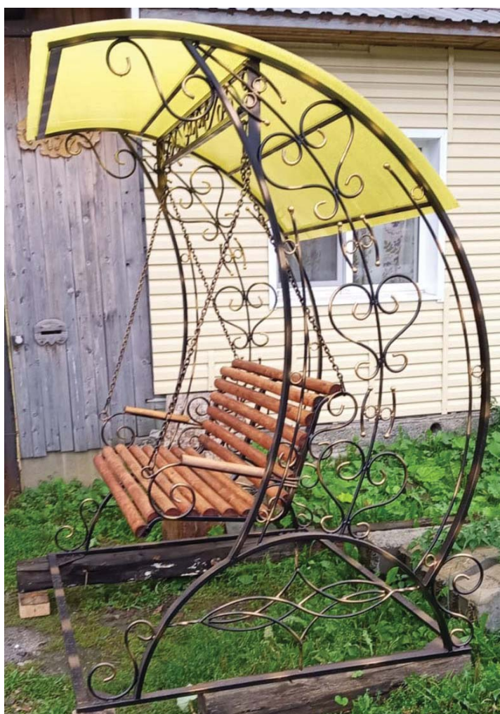
Кованые качели – красиво и трудоёмко.