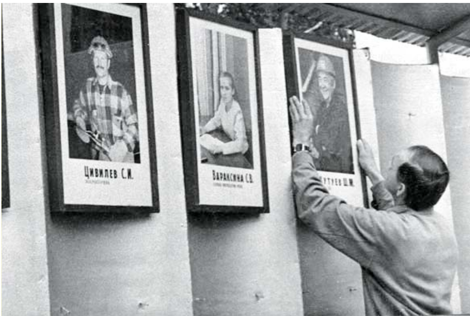
Доска Почёта, 1999 год.

В редакционном архиве сохранились снимки лучших заводчан, которые размещались цепочкой по улице Ильича. Каждая фотография устанавливалась на свой металлический «постамент», фоном для портрета было Красное знамя.