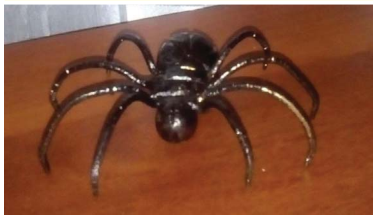
Пауки, скорпионы, улитки получаются удачно.