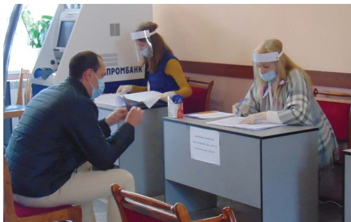
При голосовании были соблюдены все профилактические меры.