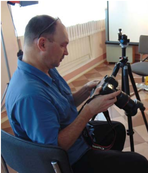
Из нескольких снимков надо выбрать лучший.

ности каждого лица, работая с тенью. Особое внимание - глазам, взгляду».