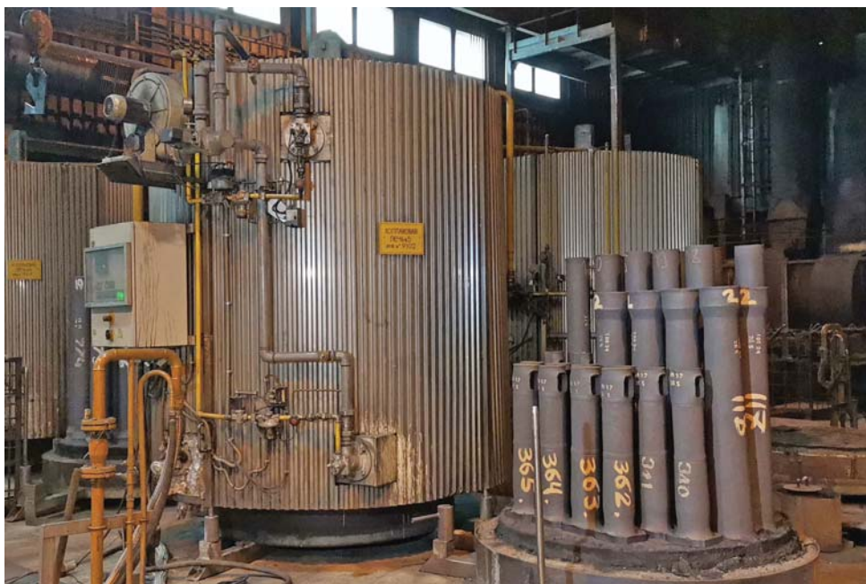
Колпаковые печи на участке КГИ.