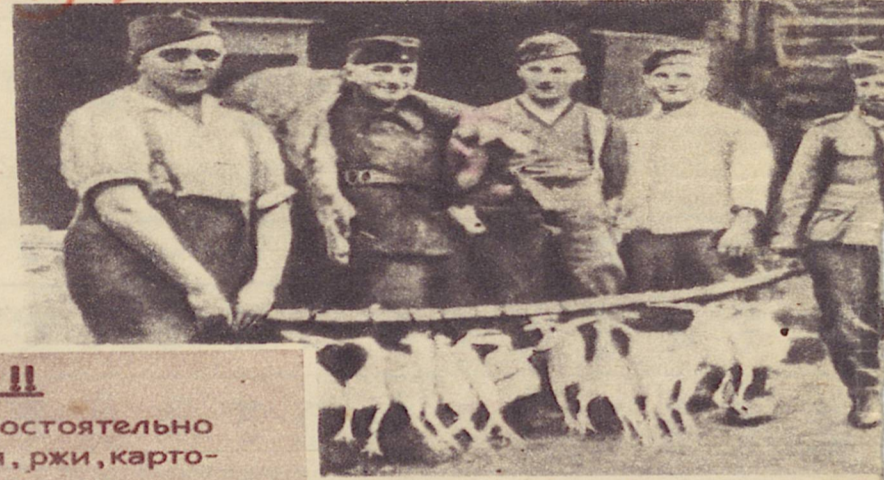
Немецкая грабь-армия. Марш с добром, награбленным у м. колхозников (Фото найдено у немецкого

Объявление II Строго запрещается самостоятельно производить сбор урожая, ржи, карто- феля и других корнеплодов. Кто это распоряжение нарушит будет на месте строго наказан. Kommandующий Германскими войсками.