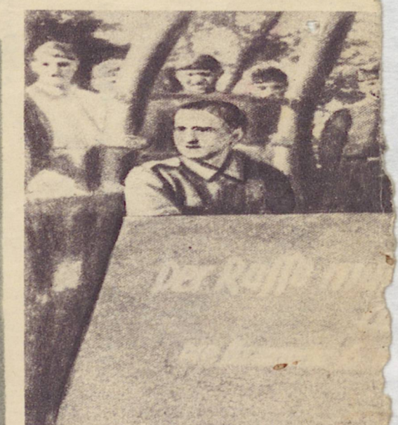
Группа немецких оккупантов надпись: „Русский должен найден у не

Объявление II Строго запрещается самостоятельно производить сбор урожая, ржи, карто- феля и других корнеплодов. Кто это распоряжение нарушит будет на месте строго наказан. Kommandующий Германскими войсками.