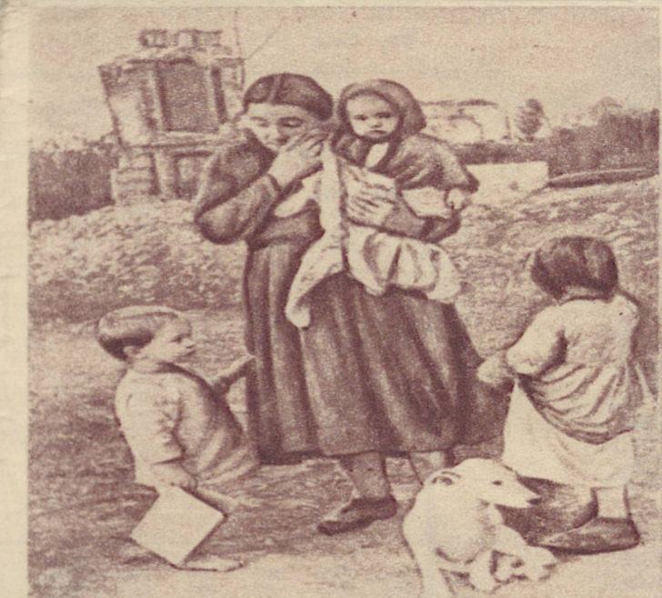
Немцы все разграбили, дом сожгли, оставили мать с малолетними детьми без крова и убежища