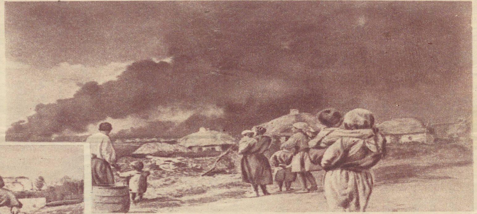
Немецкие оккупанты подожгли село.