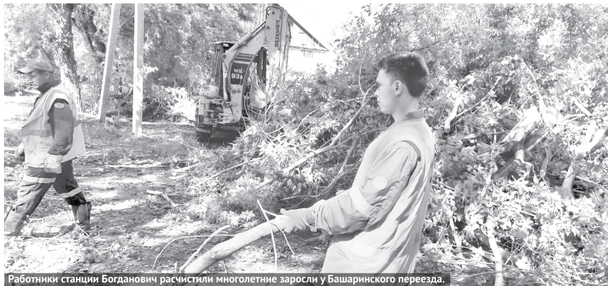
Работники станции Богданович расчистили многолетние заросли у Башаринского переезда.

На протяжении многих лет состояние сквера у бывшего клуба железнодорожников (вблизи Башаринского переезда) вызывало возмущение у богдановичцев. Что и неудивительно, ведь этот участок давно превратился в непроходимые заросли. Буквально на днях сотрудники станции Богданович провели работы по расчистке территории