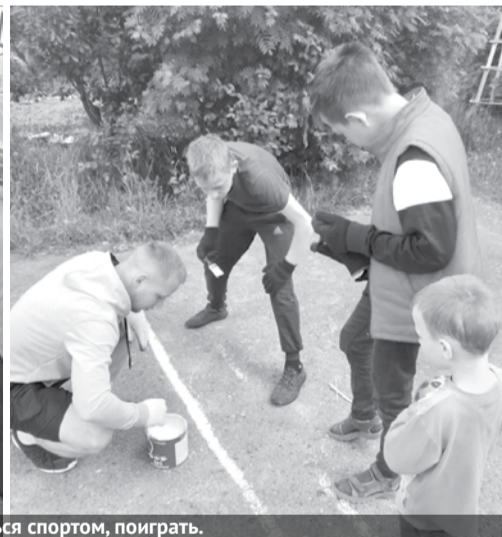
В течение дня у ребят есть возможность потрудиться, позаниматься спортом, поиграть.