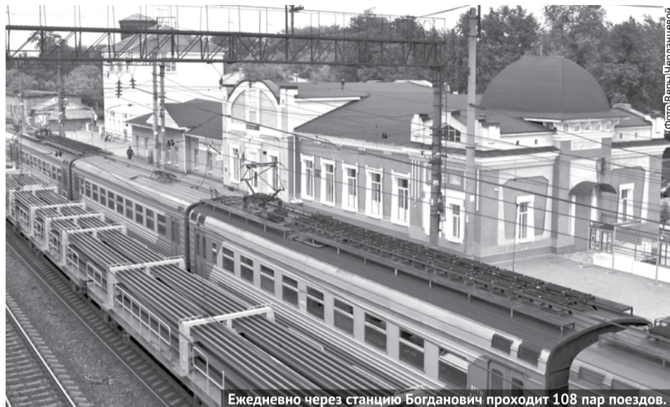
Ежедневно через станцию Богданович проходит 108 пар поездов.

современных технологиях, за счёт которых были достигнуты высокие показатели. Это приём и отправление технических маршрутов на станцию Глухово, минуя станцию Богданович. Изменение технологии обработки ускоренных контейнерных поездов назначением Москва-Богданович, Богданович-Тобольск. За счёт изменения технологии обработки поездов сократилось время простоя вагонов с 24 до 15 часов, планируется довести этот показатель до 12 часов, что существенно ускорит продвижение вагонопотоков. Добиться высоких показателей позволяет и примене-