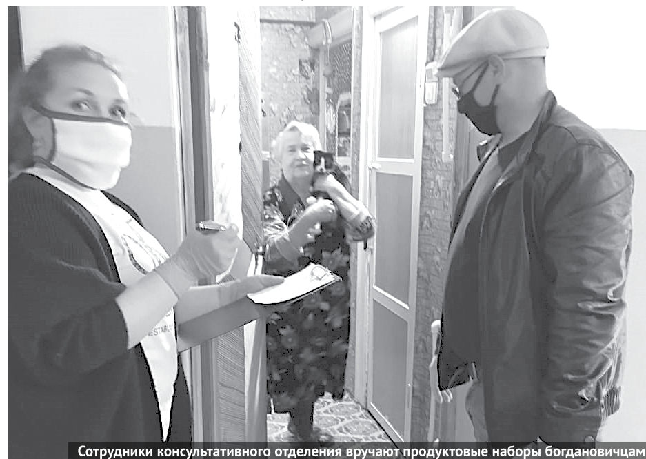
Сотрудники консультативного отделения вручают продуктовые наборы богдановичцам.

ганизует работу по реализации мероприятий социальной реабилитации и абилитации инвалидов старше 18 лет, предусмотренных индивидуальной программой. Также она осуществляет межведомственное взаимодействие между организациями, оказывающими реабилитационные услуги людям с различными ограничениями жизне-