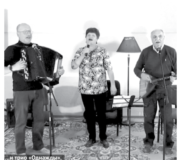
...и трио «Однажды».