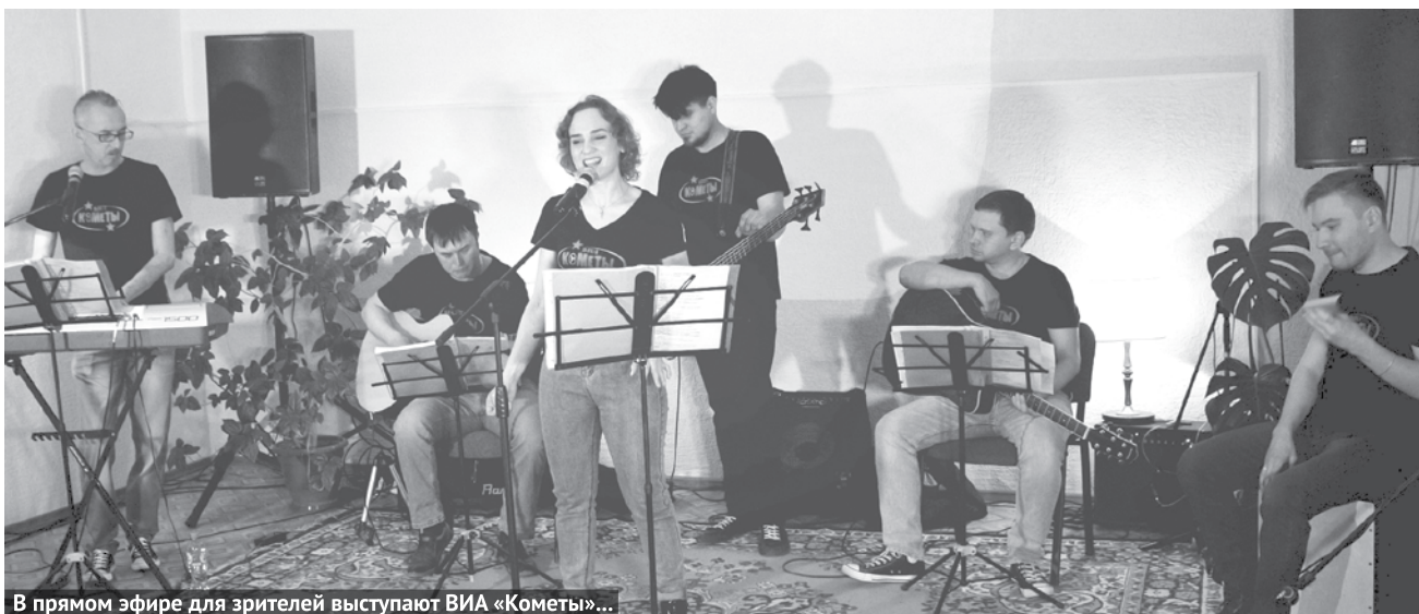
В прямом эфире для зрителей выступают ВИА «Кометы»...