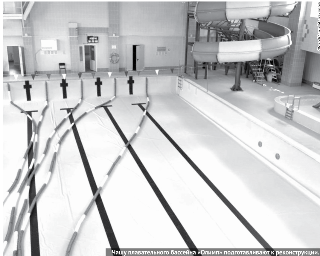
Чашу плавательного бассейна «Олимп» подготавливают к реконструкции.

Шагающий по миру коронавирус внес свои коррективы и в работу спортивных учреждений. Многофункциональный спортивный центр «Олимп» пока не принимает посетителей, но наступит момент, когда в нем снова будет оживленно. Ну а сейчас сотрудники центра активно готовятся к его открытию