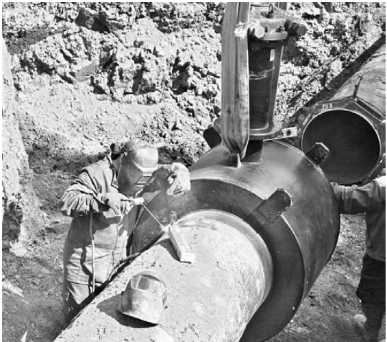
Рабочие врезали новый трубопровод в действующую систему.

Рабочие установили канровые узлы, врезали новый трубопровод в действующую систему, перемонтировали газопровод у железной дороги по улице Варшавской. Строительство газопровода высокого давления от ГРС-2 до Сибирского тракта позволит увеличить пропускную способность сетей и резервировать мощности для подключения потребителей. Стоимость инвестпроекта — свыше 240 миллионов рублей. «Территория вокруг Екатеринбурга стремительно осваивается, возрастает потребность в газоснабжении как предприятий, так и населения. В 2019-м мы привили от горожан 1 192 заявки на подключение к сетям, заключили 669 договоров на техприсоединение, и ежегодно объемы увеличиваются», — рассказал заместитель генерального директора компании «Екатеринбурггаз» Иван Паслер.