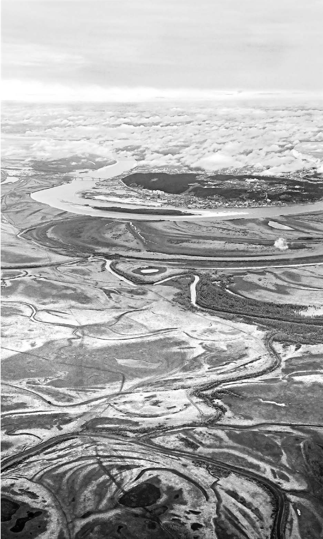
В соседней Югре проблема «тепловых пятен» стоит не так остро, потому что мерзлые грунты занимают гораздо меньше площади, чем плодородные почвы.

Аналогичная картина, только с меньшим разбросом температур, наблюдается на крупных