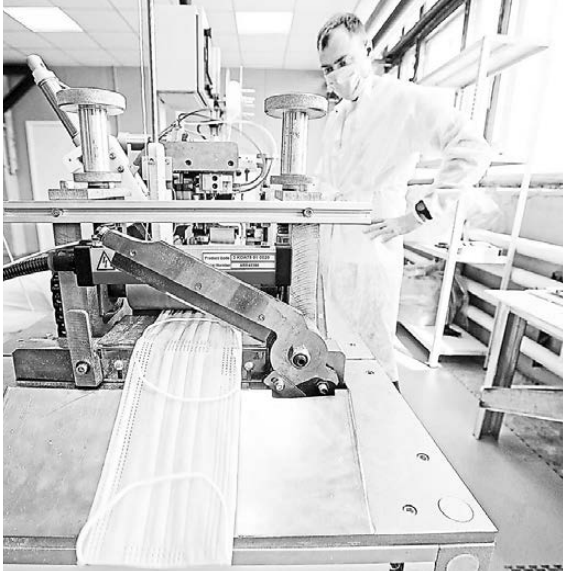
Новая линия способна выпускать 75 тысяч медицинских масок в сутки.

—Мы обсудили возможность распространения этой практики и на других производителей,—добавил чиновник. ●