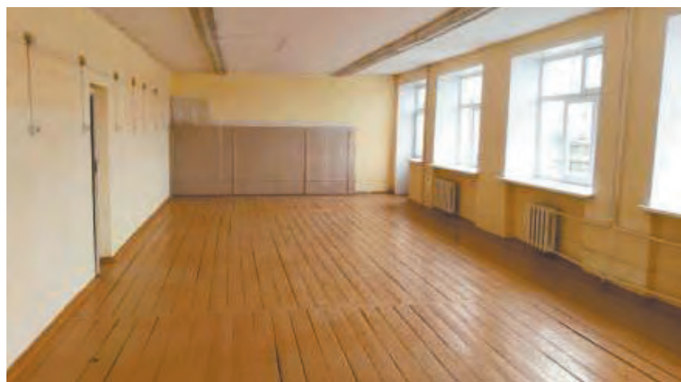
Помещение Талицкой школы № 1 до ремонта

Примечательно, что данные центры образования позволяют выявить и развить способности школьников, а также помогут при работе с одаренными детьми. На своей практике это уже успешно доказали три сельских школы – Вновь-Юрмытская, Пионерская и Кузнецовская школ, где в прошлом году состоялось торжественное открытие «Точек роста». Учащиеся создают собственные проекты, участвуют в районных выставках и с удовольствием готовы поделиться своими знаниями с ребятами из других образовательных учреждений.