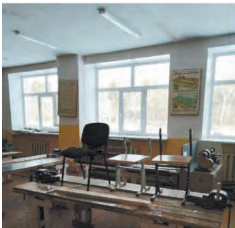
Помещение для проектной деятельности (до ремонта), март 2020 в Талицкой школе № 55

На сегодняшний день в образовательных учреждениях полным ходом ведутся ремонтные работы. Подрядная организация ремонтирует учебные кабинеты – они будут отвечать всем требованиям брендбука с логотипами «Точка роста» и оформлены в определенной цветовой гамме – белый, красный, серый и черный. Создаются просторные зоны для совместного обучения и творчества. Закуплено современное и высокотехнологичное учебное оборудование.