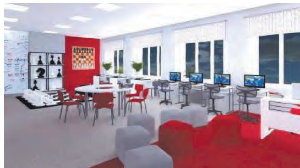
Таким оно будет после ремонта