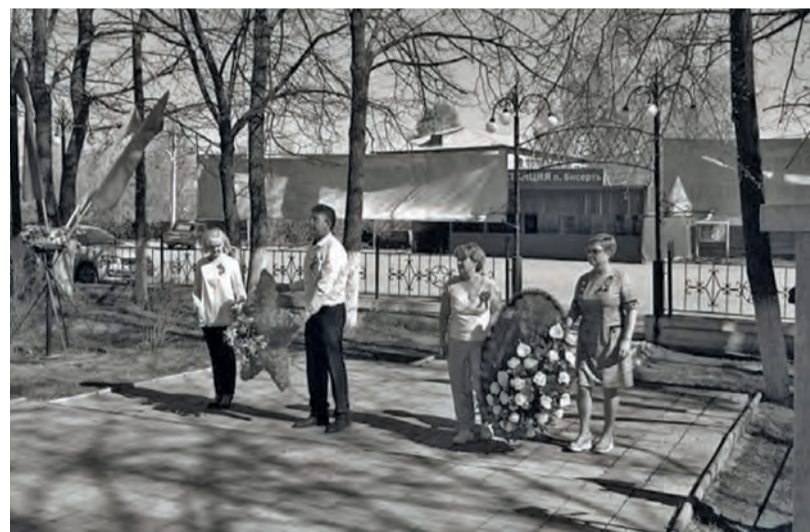
● Возложение в День Победы венков к памятнику бисертцам, погибшим в годы Великой Отечественной войны

несмотря на режим самоизоляции, ветераны без поздравлений не остались.