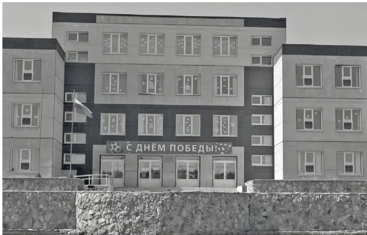
● Многие здания ко Дню Победы были украшены флагами и праздничной символикой

ПРАЗДНОВАНИЕ 75-летия Победы в Великой Отечественной войне прошло из-за пандемии коронавируса довольно нестандартно - без массовых шествий и прочих привычных атрибутов. Но, возможно, некоторые новые традиции и акции (такие как «Окна Победы» и «Фонарики Победы») приживутся и впоследствии - когда все карантинные меры будут упразднены за ненадобностью.