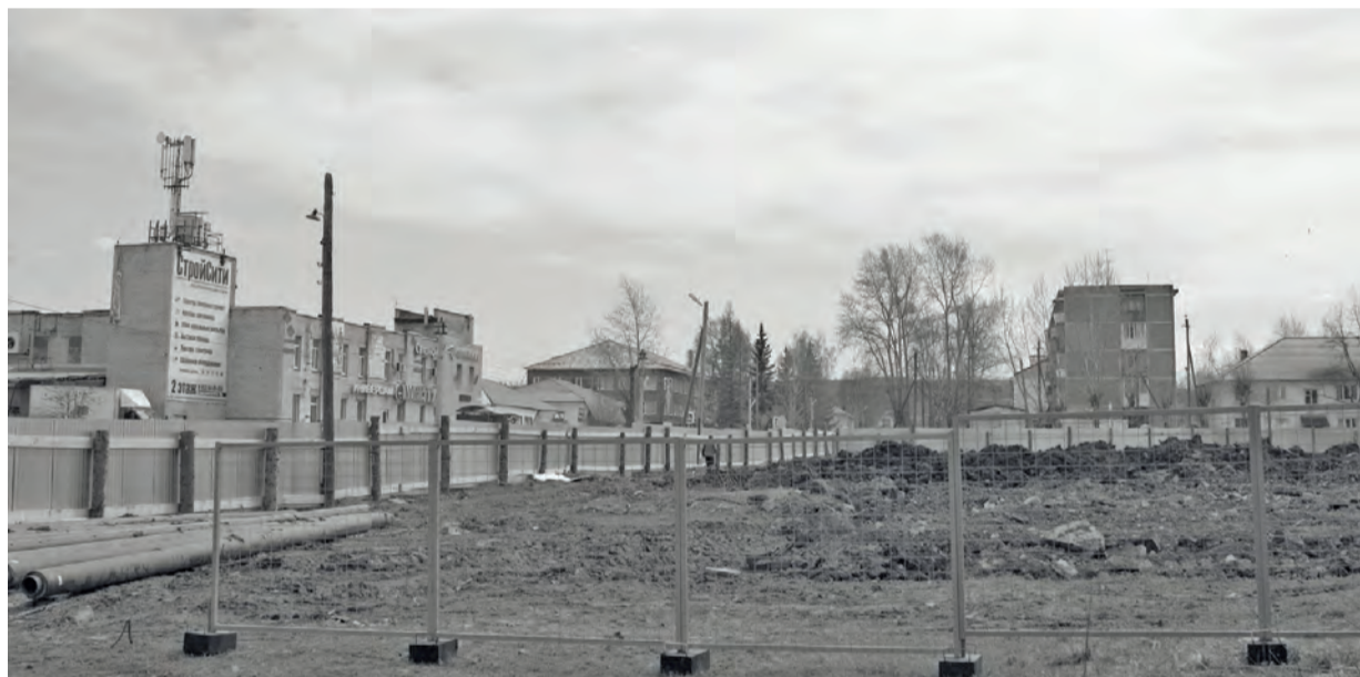
● Несмотря на эпидемию, работы в сквере активно идут

Несмотря на то, что весь мир сидит на карантине и борется с коронавирусом: вся запланированная работа ведётся, пусть и с мерами предосторожности, но упорно и вполне успешно.