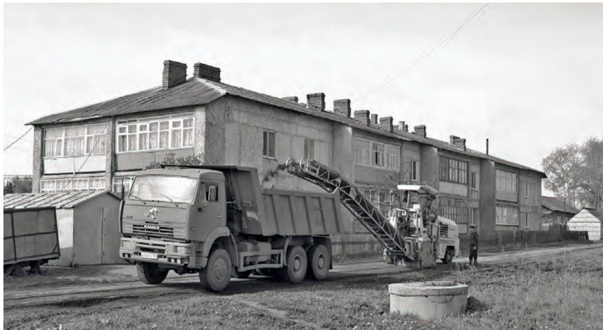
● Срезка старого асфальта на улице Тупиковой

«Управление городского хозяйства» обращается к жителям вышеозначенных улиц с просьбой очистить придорожное пространство, дабы мусор и складированное добро не мешало проведению ремонта.