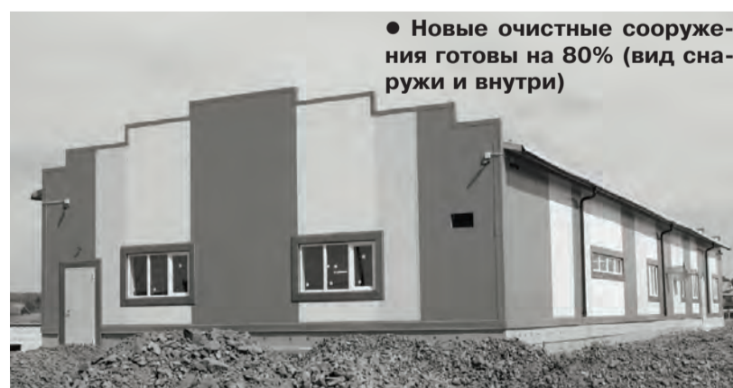
● Новые очистные сооружения готовы на 80% (вид снаружи и внутри)