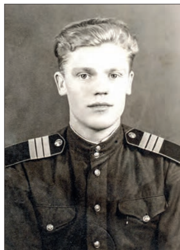
Берлин. Март 1949 г.