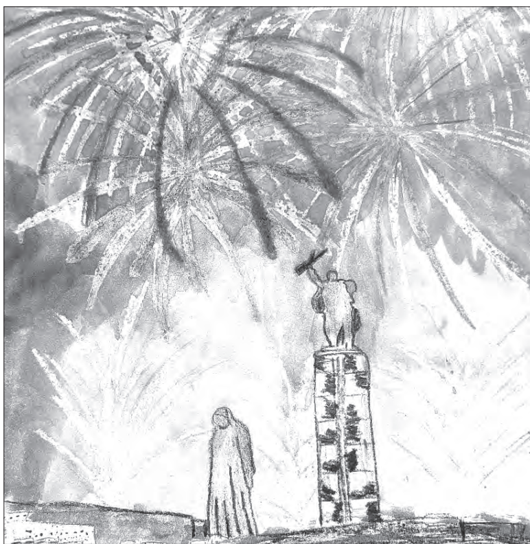
«Салют! Победа!» / АЛЕКСАНДР МАХНЕВ, 2 КЛАСС, ШКОЛА № 1