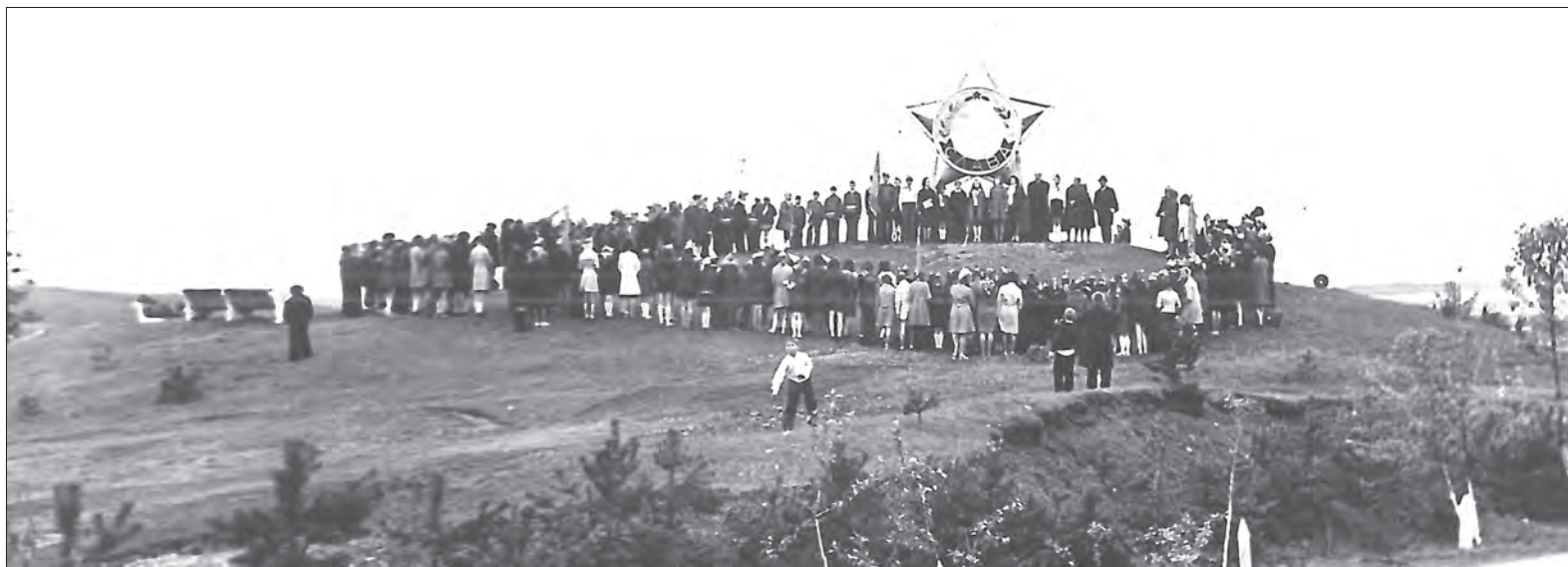
Митинг у «Ордена Славы». Год неизвестен

Как к 30-летию Победы в Нижней Туре появился еще один памятник солдатам Великой Отечественной и что сегодня смущает в нем его создателей