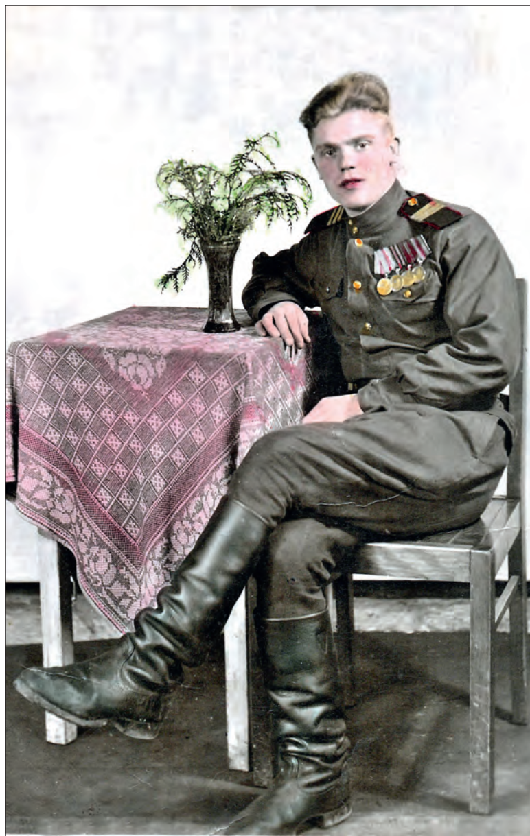
Апрель 1950 г. Берлин. Перед дембелем

И вдруг в одном из танков неожиданно разглядел Леонид