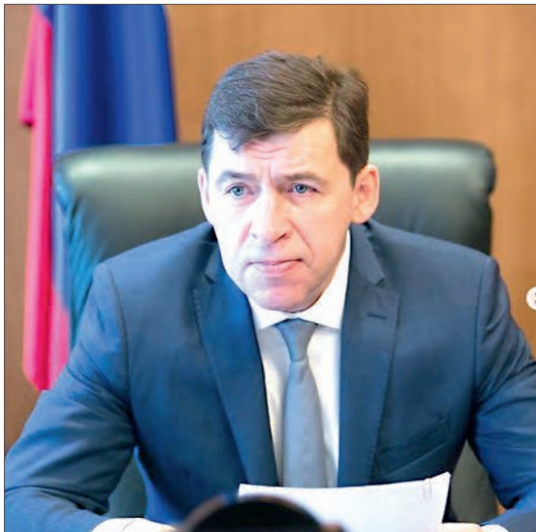
О своей проблеме вы можете сообщить губернатору Евгению Куйвашеву через Управление по работе с обращениями по телефонам: 8 (343) 385-77-77, 8 (343) 354-01-55 или по почте: pso@egov66.ru

У нас за 1,5 месяца эпидемии после появления первого больного (17 марта) умер один человек. Почему в регионе такая низкая смертность от коронавируса в про-