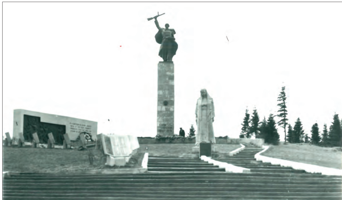
«Слава героям 1941-1945» – такие слова были на пьедестале Солдата-Победителя в день открытия мемориала и до реставрации в 1980-х годах

Силами предприятий Нижней Туры, Иса, Качканара была создана строительная бригада, выделена техника, строительные материалы, проведены бетонные работы, установлены каменные скульптурные фрагменты. На машиностроительном заводе отлили фигурную решетку и горелку Вечного огня. Газовики сделали газовую подводку. Энергетики проложили под-