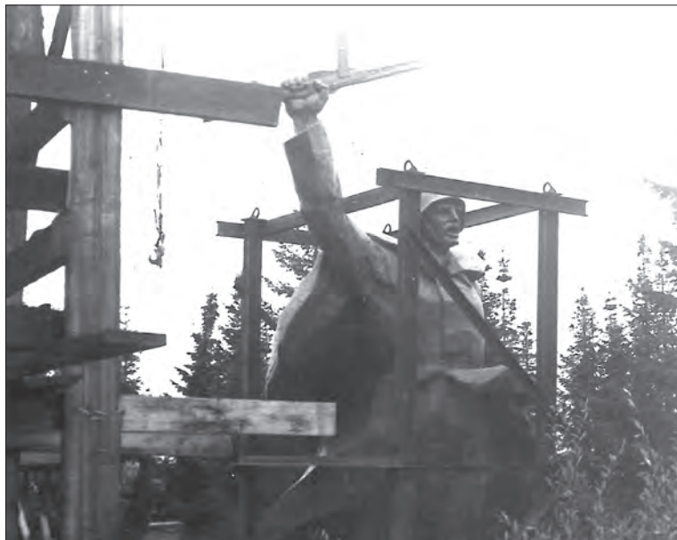
В фотоархиве редакции нашлась такая уникальная фотография периода реставрации монумента. Скульптура Солдата-победителя в специальном контейнере была спущена на землю