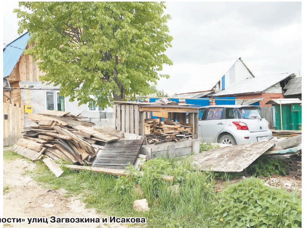
Рукотворные «достопримечательности» улиц Загвозкина и Исакова