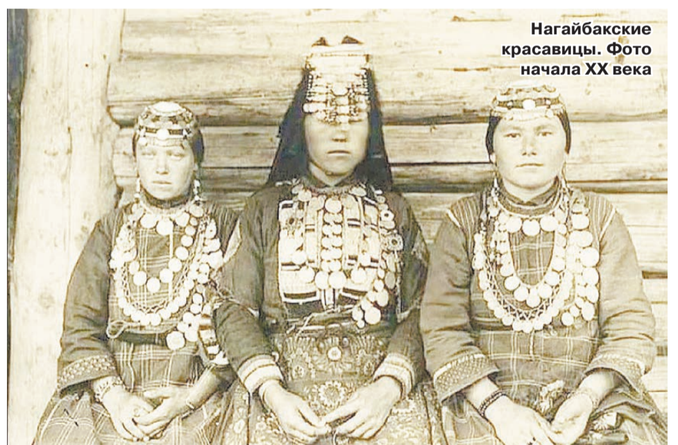
Нагайбакские красавицы. Фото начала XX века

Главную достопримечательность Парижа, как и положено, видно издалека. Эйфелева башня находится в центре села, на Советской улице. И если французы приспособили свою башню для