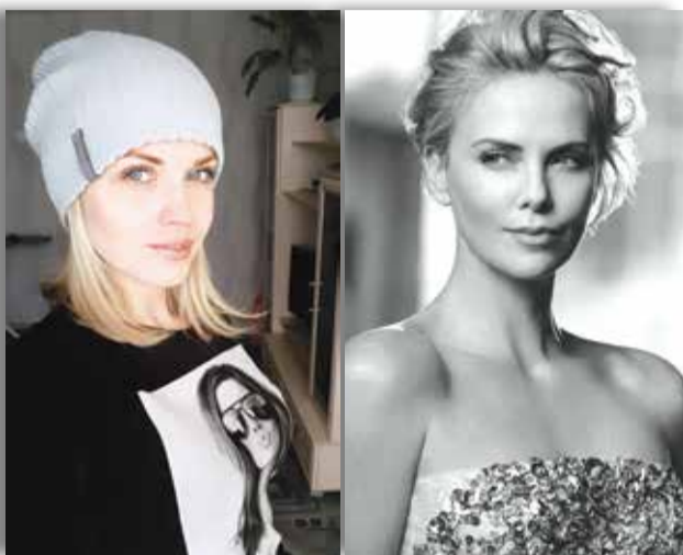
Ирина Тимшина и Шарлиз Терон, южноафриканская и американская актриса и продюсер