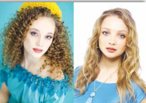
Виктория Боровских и Екатерина Вилкова, российская актриса театра и кино

Ученые уверены, у каждого из нас в мире есть как минимум семь двойников. Короли и политики всегда держали при дворе людей, похожих на себя. Например, у Наполеона, по предположениям историков, было сразу четыре копии.