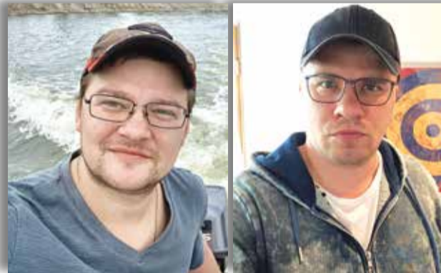
Артём Носарев и Гарик Харламов, шоумен