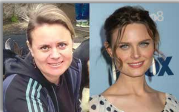
Алла Топорищева и Эмили Дешанель, американская актриса, продюсер