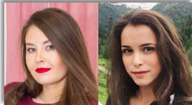
Альбина Федорова и Мила Сивацкая, украинская актриса