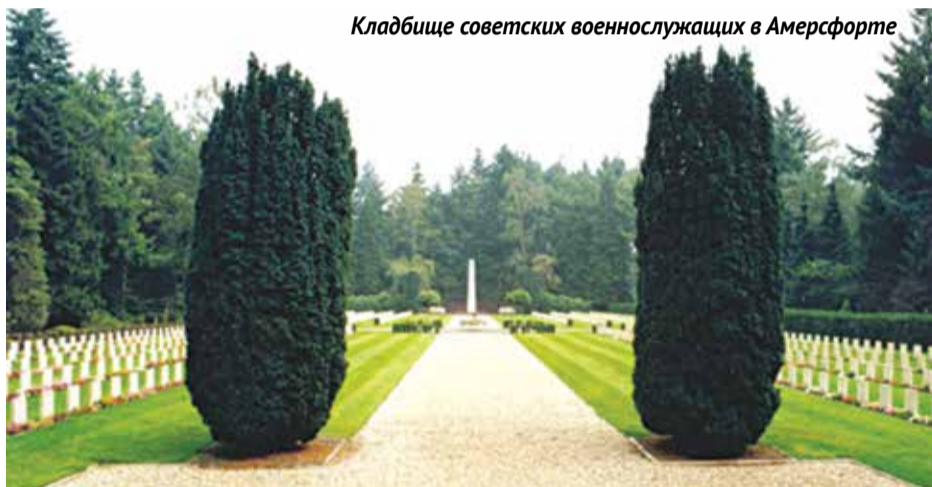
Кладбище советских военнослужащих в Амерсфорте

Сегодня ни для кого не секрет, в каких нечеловеческих условиях находились люди в фашистском плену: голодали, умирали от холода, от непосильного труда на фабриках, строительстве дорог, заводов, рудниках и шахтах; умирали от прихоти озверевшего от скуки лагерного начальства или потому, что считались самой низшей категорией пленных, за гибель которых охрана практически не несла ответственности.