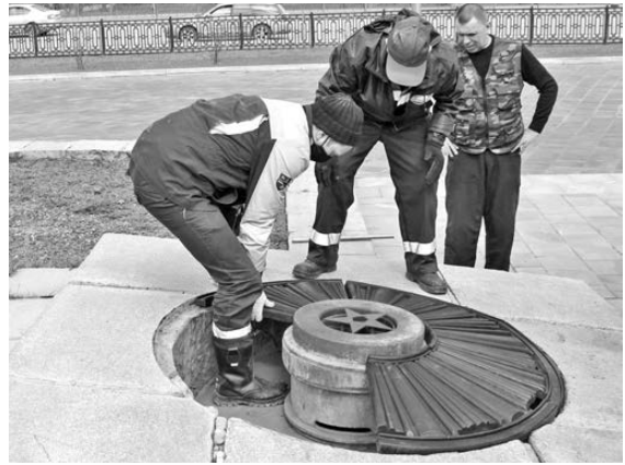
Екатеринбургские газовики уже более 60 лет являются хранителями Вечного огня.

В преддверии юбилея Победы специалисты предприятия «Екатеринбурггаз» провели техобслуживание и подготовку вечного огня на площади Коммунаров в Екатеринбурге: привезли в порядок декоративные плиты и установили новый защитный механизм для предотвращения попадания мусора в чашу. Напомним, Вечный огонь был зажжен в Свердловске в июле 1959 года. Первоначально он питался от резервуара со сжиженным газом и требовал постоянной заправки. В начале нулевых к памятнику подвели природный газ.