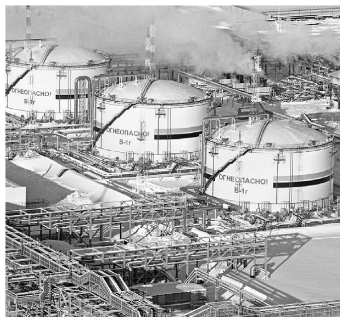
Для предприятий нефтегазового комплекса заражение персонала коронавирусом несет действительно большую опасность.

— Бизнес в основном выручает постоянные заказчики, на заработанные на продаже хлеба деньги я закуплю другие товары для своих магазинов. Бывает, что местные поставщики тоже помогают, например, позволяют оплатить часть суммы в рассрочку, — добавляет предприниматель. Он признается: семейный бизнес приносит небольшую прибыль, но этого хватает, чтобы жить самим и поддерживать в трудный час земляков. Мелибовые планируют бесплатно раздавать ежедневно около 40 буханок. ●