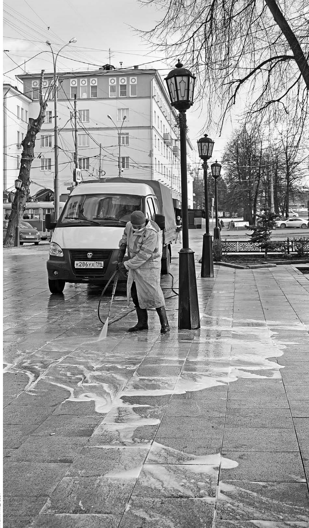
«Зеленстрой» начали работу с Исторического сквера, уже отчистили памятник отцам-основателям Татишеву и де Геннину. Горожане надеются, что очередь дойдет и до длинного фрагмента стены с коваными воротами и решеткой рядом с кол-

Еще одна задача месячника чистоты — очистка памятников от граффити. Сотрудники МБУ