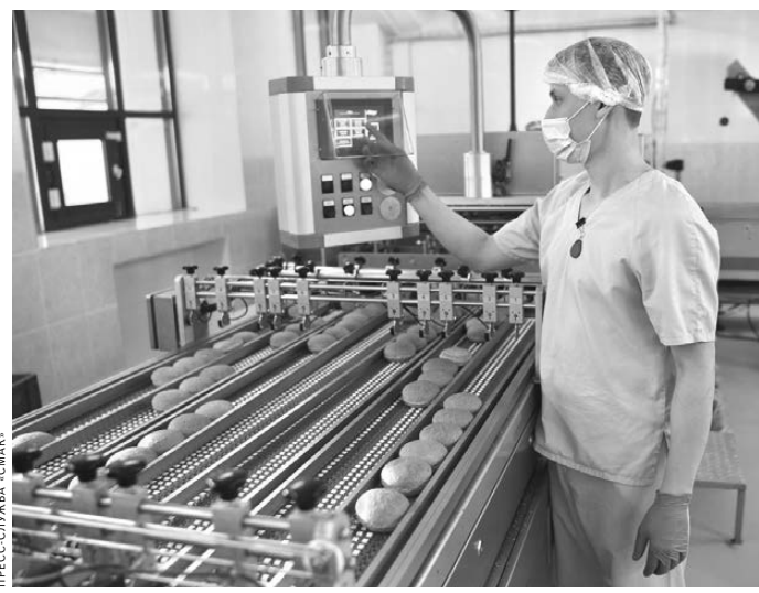
У пекарей сегодня горячие времена: спрос на хлебобулочные изделия вырос.

— Мы работаем спокойно и даже строительно во второй площадке не сворачиваем, хотя с повышенным вниманием следим за происходящим. Ведь раньше с такой ситуацией никто не сталкивался: ни предприятия, ни власти, ни контролирующие органы. Но нашему предприятию