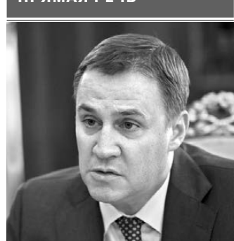
Дмитрий Патрушев, министр сельского хозяйства РФ:

—Безусловно, остановка на российском аграрном рынке зависит от своевременного и качественного проведения весенних полевых работ, которые набирают обороты. Обеспеченность основными материально-техническими ресурсами и цены на них стабильные. Несмотря на сложившуюся ситуацию при проведении посевной нет. Мы постоянно на связи с субъектами, оказываем всю необходимую поддержку. Как и в предыдущие годы, рассчитываем на достойный урожай.