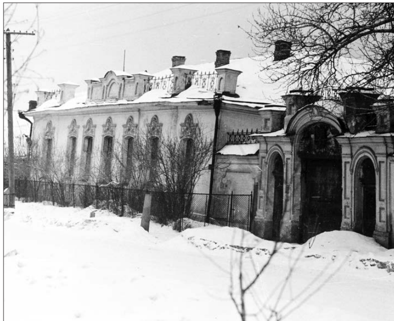
Исторический облик здания музея, 50-е годы 20 века

Вскоре наша организация пополнилась за счет более младших возрастов молодежи, особенно много вступило в Союз воспитанников детского дома. Насколько велика была в то время тяга молодежи в РКСМ, говорит хотя бы та-