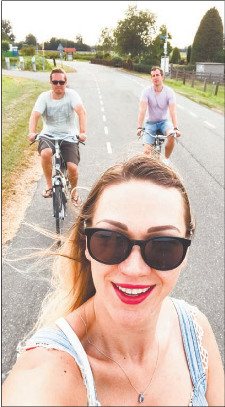
Велосипед – самое популярное средство передвижения в стране, их здесь около 16 миллионов. Велосипед есть у каждого жителя страны. В Амстердаме количество велосипедов превышает количество жителей города