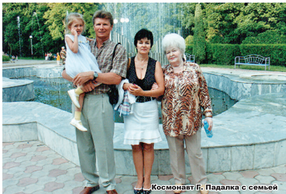
Космонавт Г. Падалка с семьей

Слушали затаив дыхание. Задали гостю массу вопросов. Не страшно ли летать? На каком языке общаетесь? Где и сколько спите? Чем занимаетесь в свободное время? Про женщин и психологическую совместимость, про политику, про полеты