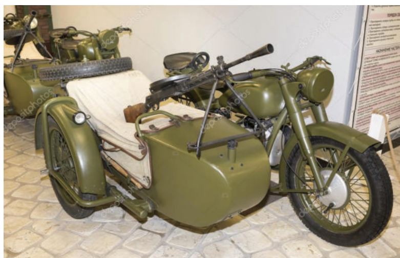
«Боевая колесница» пехоты М-72.

Настоящей кузницей этих, в полном смысле слова, «боевых колесниц» был мотоциклетный завод, эвакуированный в годы войны в Ирбит из Москвы. Приказ о его переводе на Урал был принят Наркоматом обороны 21 октября 1941 года. Вслед за заводским оборудованием в Ирбит прибыл 17 ноября и инженерно-технический персонал. Мото заводцев, эвакуированных из столицы вместе с заводом, расселили в городе и окрестных деревнях. Многие жители при-