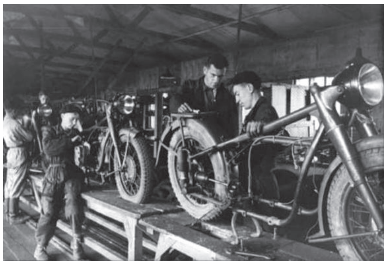
Мотоцикл М-72 на конвейере мотозавода.