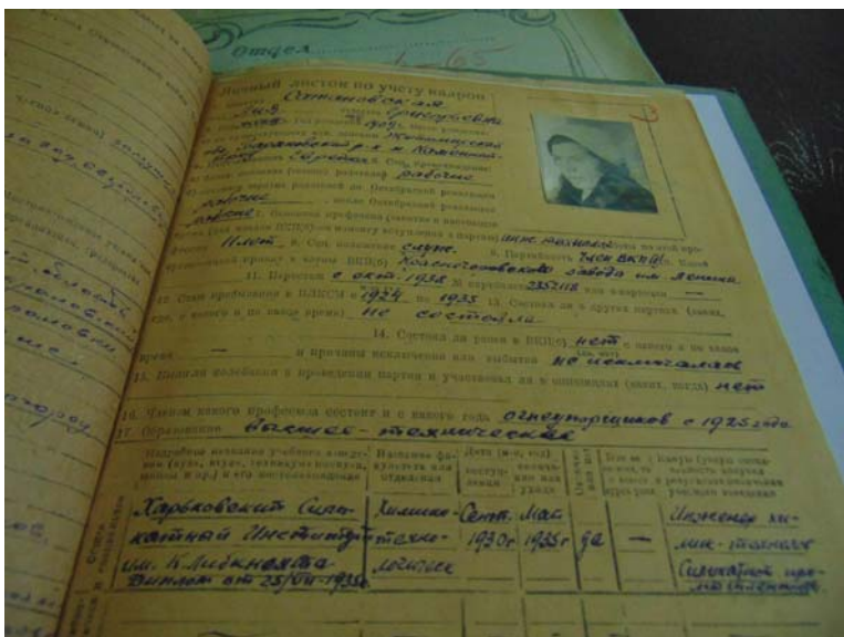
Инженер-технолог Лия Сатановская в 1941-м эвакуирована из Красногоровки вместе с мужем.